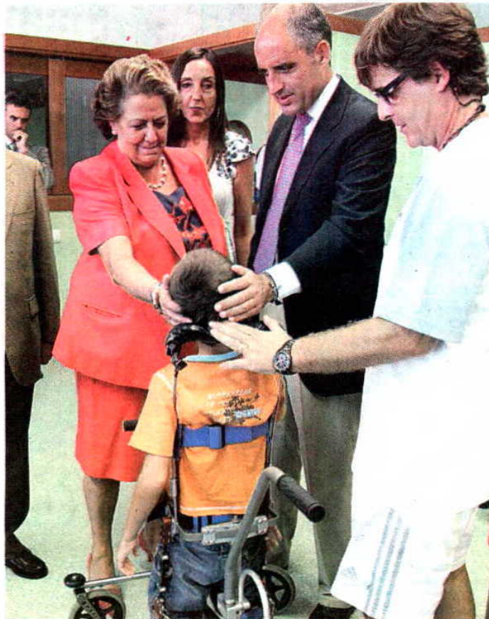
La alcaldesa y el presidente con un alumno.

El centro, ubicado en el entorno del nuevo Hospital La Fe, tiene 11.000 metros cuadrados de espacio y 210 plazas para alumnos de 3 a 21 años. En total, dispone de 27 unidades, con comedor y vivienda para el conserje y sobre todo un personal docente muy preparado para poder atender a los numerosos ni-