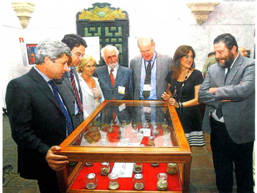
► Autoridades y ponentes comentan la exposición que ilustra el seminario antes de su inauguración.