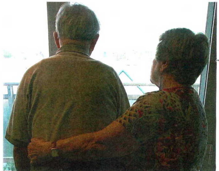
El gasto anual de un paciente de alzhéimer es de 30.000 euros D. G. LÓPEZ

La presencia de esta anomalía genética se relaciona también con la aparición de otro indicador de la enfermedad: una forma particular de la proteína TAU en el fluido cerebroespinal. La combinación de ambos datos permitirá saber si los efectos devastadores de la enfermedad se acelerarán. Será una información útil para los pacientes y sus familias y también para los médicos que podrán diseñar mejor sus ensayos clínicos. Si los investigadores saben de antemano qué enfermos progresará con rapidez, evaluarán mejor los efectos de nuevos fármacos diseñados para retrasar la progresión del mal.