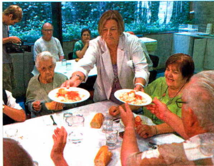
► Usuarios del comedor social del Espai Gent Gran Sant Antoni, ayer.

Crisis aparte, la realidad es que en Barcelona más de 50.000 personas de más de 75 años viven solas, y que cerca del 60% de los mayores cobran pensiones por debajo de los 600 euros. La combinación de pobreza y soledad es dramática entre este colectivo. Por eso, el ayuntamiento inauguró hace dos décadas su primer comedor social en Ciutat Vella integrado en un centro para mayores, una iniciativa que a la par que garantizar la alimentación pretende prevenir el riesgo de aislamiento en que viven algunos. El programa se ha ido extendiendo y a final de mes ya estará presente en todos los distritos merced a la inauguración de siete nuevos comedores. Eso supone 175 plazas más que aumentarán hasta cerca de 700 los menús que se ofrecerán a diario en los 20 equipamientos que dispondrán de este servicio.