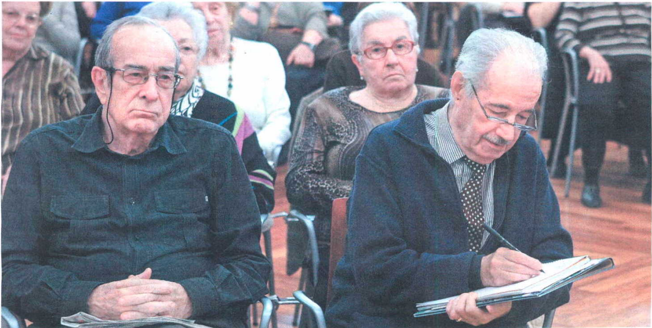
Un grupo de jubilados asiste a una conferencia sobre literatura en la Universidad de Barcelona el pasado 6 de mayo. / TEJEDERAS