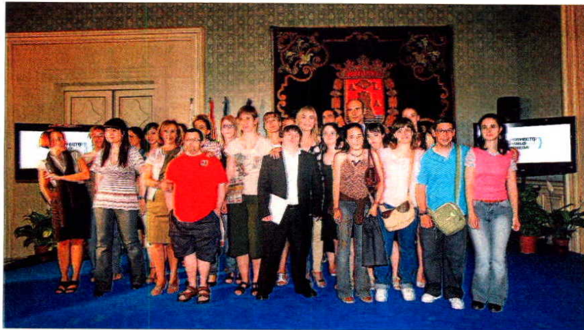
Participantes en el proyecto que asistieron al acto de clausura en el Ayuntamiento. PILAR CORTÉS

La finalización del proyecto se celebró con un concurrido acto al que acudió el propio Pablo Pineda, quien desde el primer día había mostrado su total apoyo a la iniciativa prestándole incluso el nombre. También contó con la asistencia de la alcaldesa de Alicante, So-