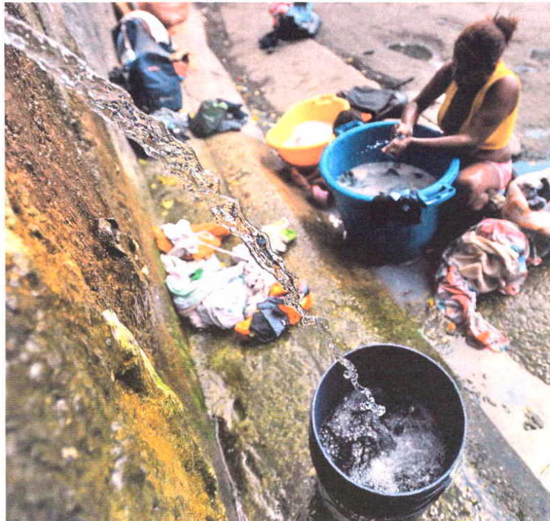
La pobreza, como la de esta barriada de Caracas, se ha convertido en caldo de cultivo de la violencia

Los homicidios, los robos y los secuestros se han triplicado en los últimos once años, casi los que lleva Chávez en la Presidencia. Los crímenes de Anzoátegui muestran que el país se desangra por sus cuatro costados, aunque Caracas, la ciudad más poblada con sus cuatro millones de ha-