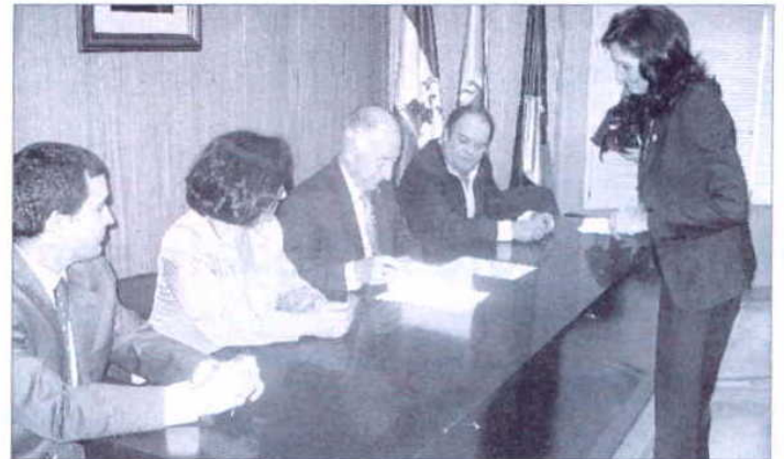
■ Momento de la firma del acuerdo.