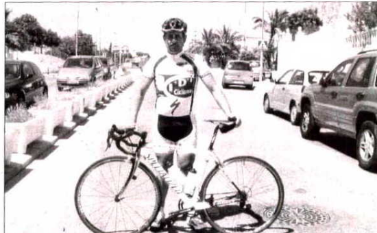
■ El ciclista almeriense es un ejemplo a seguir por su trabajo, superación y constancia, y será un referente en la enseñanza de este deporte a los más pequeños.

→ El pasado mes de junio logró medallas de oro y plata en una de las pruebas de la Copa del Mundo celebrada en Segovia