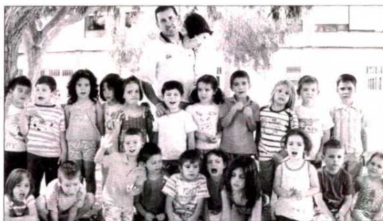
■ Actualmente colabora con una Escuela de Pequeños Ciclistas, de 4 a 5 años de edad, en el Colegio Buenavista de Huércal de Almería.

ña, tanto en la modalidad de pista, como en carretera (línea y contrarreloj), pruebas que se celebraron en el Parque del Retiro de Madrid.