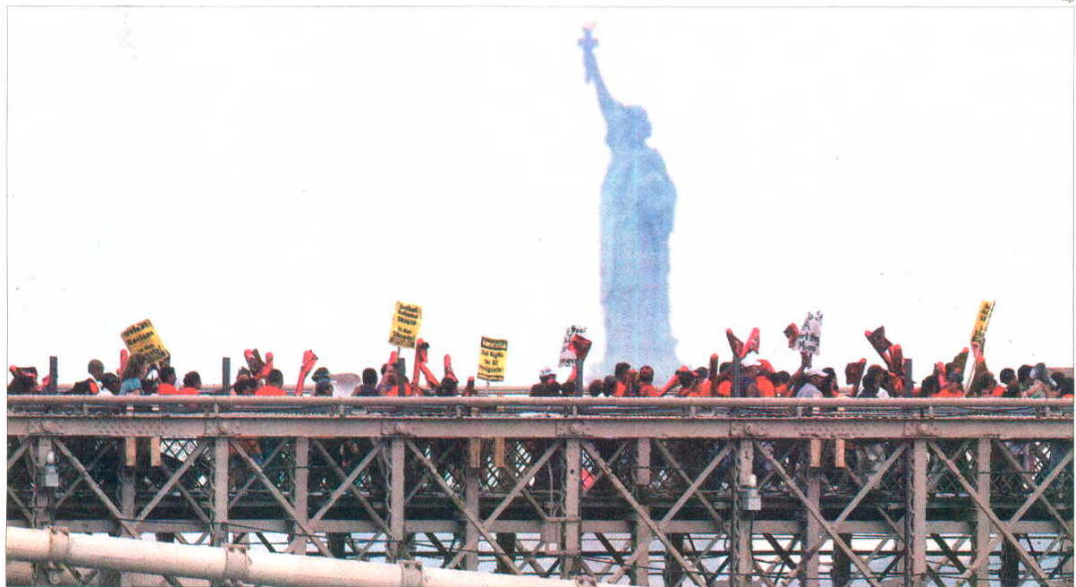
Grupos proinmigrantes se manifestaron ayer en Nueva York a favor de una reforma migratoria en Estados Unidos y contra la ley de Arizona

Así las cosas, los republicanos de Arizona se han atrincherado al completo para iniciar la que predicen como una «larga batalla», en la que la interpretación de la Décima enmienda —reguladora de las competencias federales y estatales— será el arma principal utilizada por unos y por otros. El presidente del Partido Republicano