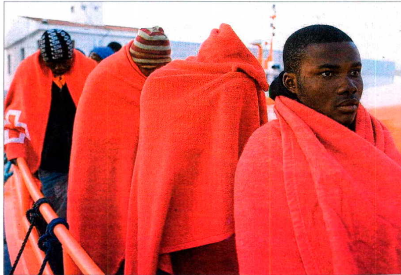
Cuatro de los 43 inmigrantes interceptados en una patera cerca de la isla de Alborán este mes de enero

Aunque pueda extrañar este incremento en un año en que la economía española y europea ha estado prácticamente congelada, los expertos policiales consideran que es fruto del clima de revueltas experimentado en los di-