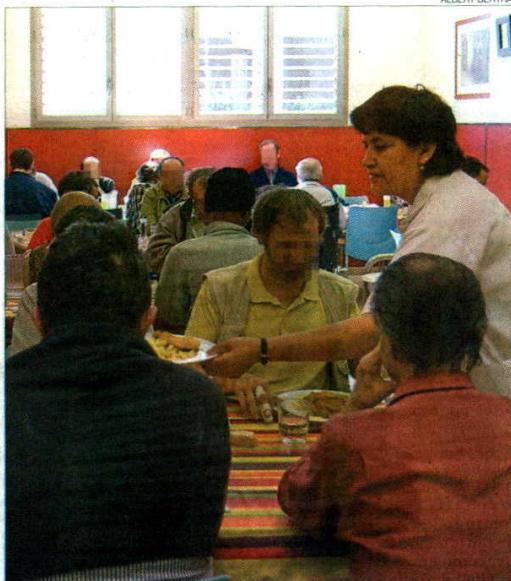
► Usuarios del comedor social de Arrels en el Paral·lel de Barcelona.

«Pero dicho esto -prosiguió la presidenta de los asistentes sociales catalanes- hay que recordar al Govern que tiene unos deberes de aten-