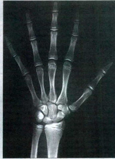
► 18 AÑOS QUE PARECEN 14. El cartilago de crecimiento está abierto, por lo que se le podría atribuir 14 años cuando en realidad es un mayor de edad de 18 años y 2 meses.