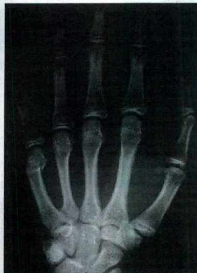
► 16 AÑOS QUE PARECEN 19. Si se compara esta imagen con las que fija el Atlas de Greulich y Pyle [uno de los estándares que se utilizan] se atribuirían 19 años a un menor de 16.

que se reforme la Ley de Extranjería para garantizar el derecho del menor a estar asistido por un abogado en este proceso.