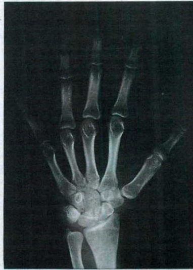
► 13 AÑOS QUE PARECEN 18. La radiografía es de una persona que estaba siendo estudiada por un servicio de pediatría por talla corta. La prueba le adjudicaría 18 años. En realidad tiene 13.