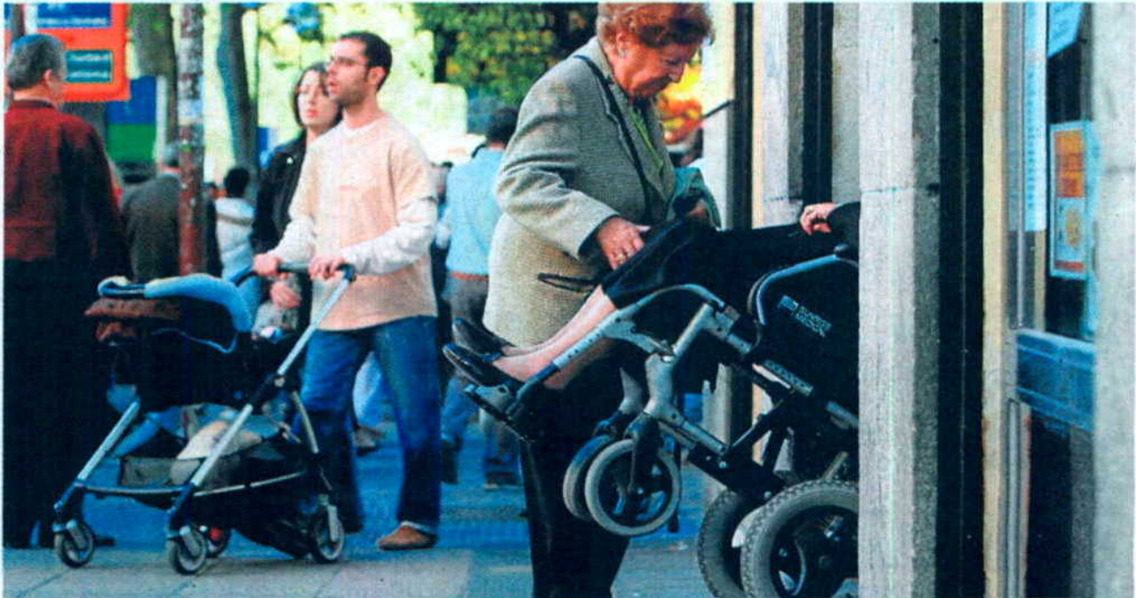
Discapacitados y ancianos son los más afectados por las medidas anunciadas por la Generalitat. MÓNICA PATXOT

SERVICIOS SOCIALES » Algunos servicios han comunicado que no podrán pagar nóminas