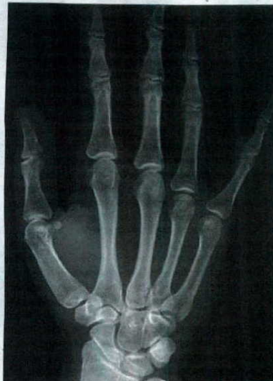
► 15 AÑOS QUE PARECEN MÁS DE 18. Tiene 15 años y 11 meses, pero su radiografía es muy similar a la de una persona de más de 18 años, según uno de los estándares más utilizados.