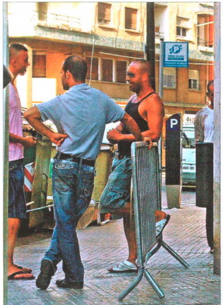
La Plaza Compte de Reus horas después de la redada.