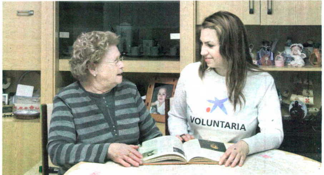
Una voluntaria de La Caixa, durante una actividad de la Obra Social.

El Programa de Ayudas a Proyectos de Iniciativas Sociales de la Obra