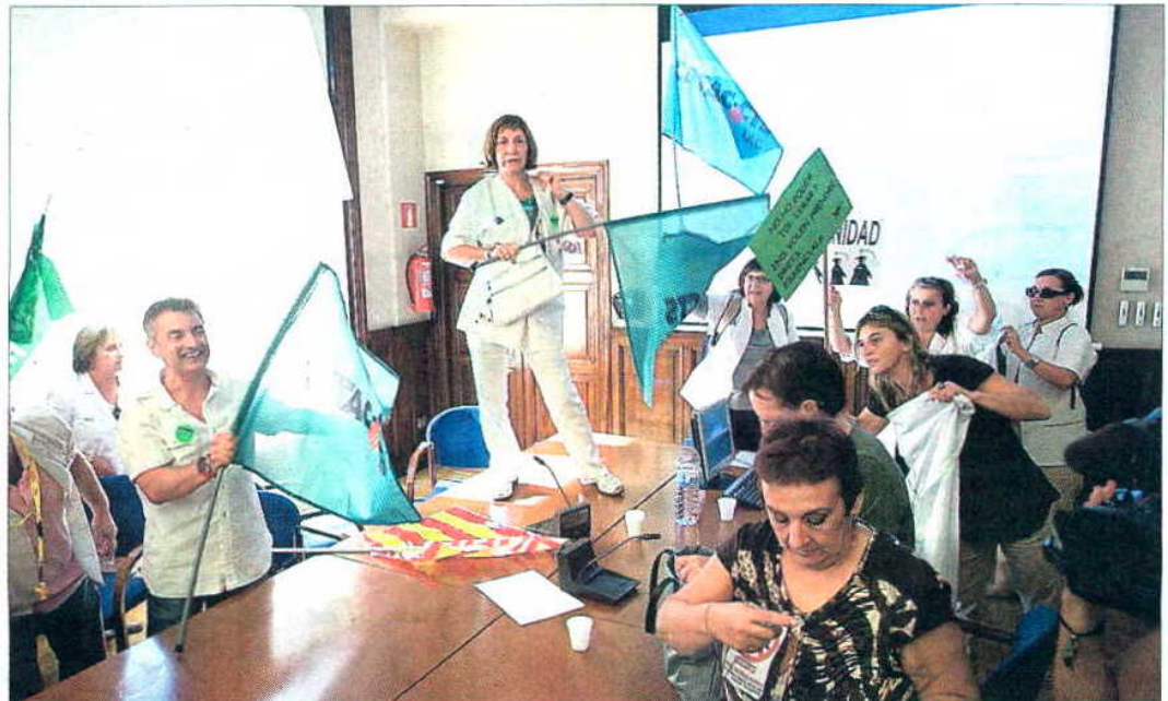
Empleados del Instituto Catalán de Salud obligan a suspender la reunión sobre recortes.

"Nos sentimos aliviadas", señaló en una nota la Mesa del Tercer Sector, organización que agrupa unas 4.000 de las entidades afectadas. "Pero nos queda el miedo de saber cuál será el próximo episodio", admitieron directivos de la organización.