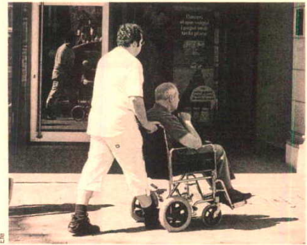
La CE considera que el voluntariado refuerza la identidad europea.

Además, Bruselas ha anunciado la creación en 2012 de un cuerpo voluntario europeo de ayuda humanitaria. Finalmente, la CE se compromete a explorar la posibilidad