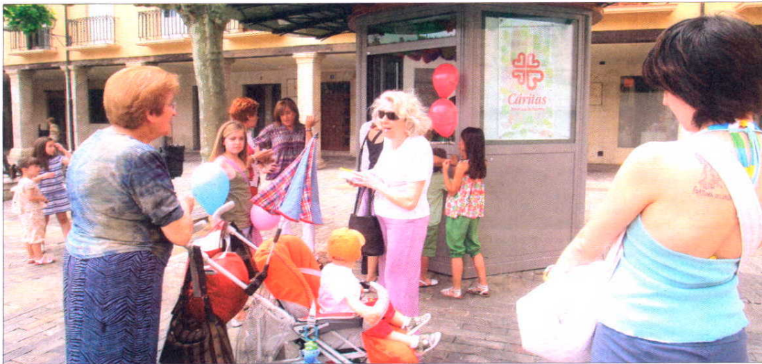
Instalaron una caseta en la Plaza Mayor en la que ayer repartían información a los adultos y globos a los niños, además de entradas al espectáculo de marionetas.