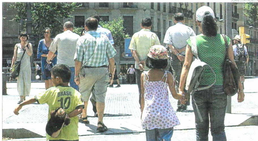
► Una familia de inmigrantes, ayer a mediodía, a la salida de una escuela de Barcelona.

El regreso de inmigrantes a sus países de origen a consecuencia de la crisis económica ha comenzado a advertirse con nitidez entre la población escolar. Desde comienzos de la presente década, la llegada de extranjeros durante el curso unida a la desaforada movilidad geográfica de las familias —una combinación para la que llegó a acuñarse el término matrícula viva — ha constituido uno de los imponderables que han mantenido en jaque a los centros públicos de las zonas donde se concentran los recién llegados. La tendencia, sin embargo, parece haberse invertido en los últimos meses. De octubre a abril, la suma de los alumnos de 3 a 16 años que han abandonado tanto la red pública como la concertada (25.119), ha rebasado por primera vez a la cifra de los que se han matriculado (24.149).