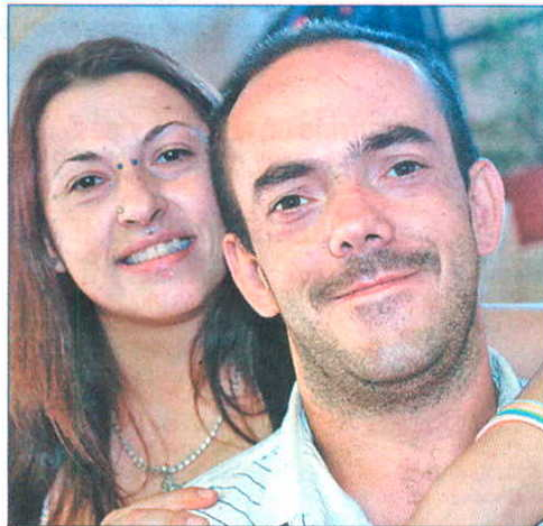
La entrega de alimentos en www.que.es/madrid

Las escenas, inimaginables hasta hace poco tiempo, se suceden en la Cruz Roja de Móstoles. Un familia acude desesperada en busca de leche y arroz. Una anciana espera resignada alimentos en la larga cola y otra mujer llora desconsolada porque unos intrusos acaban de robarle en la puerta la comida que hace minutos recibió. Así transcurrió ayer la mañana en la sede de la ONG del municipio, que lanzó en Madrid un programa solidario de alimentos para entregar 3,5 millones de kilos de comida a 80.000 personas castigadas por la necesidad.