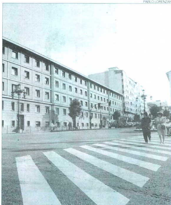
►► El barrio de La Tenderina.