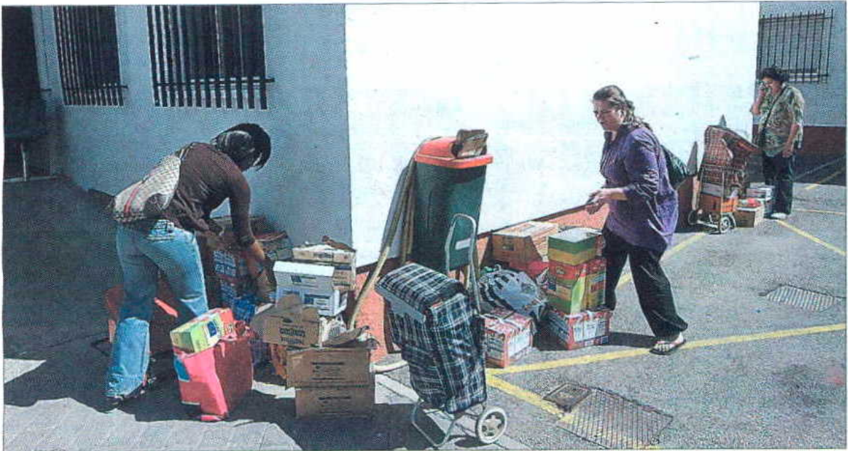
REPARTO DE COMIDA SOLIDARIO. Cruz Roja comenzó ayer el reparto de 3,5 millones de kilos de alimentos en la región destinados a unas 80.000 personas. Móstoles inauguró la campaña. Allí se han distribuido cerca de 60.000 kilos de comida entre más de 400 familias de la localidad.