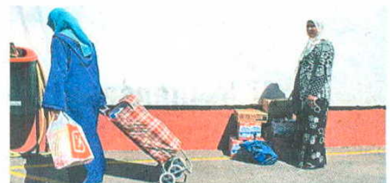
Esta mujer descuidó un instante los alimentos recibidos, y le robaron.