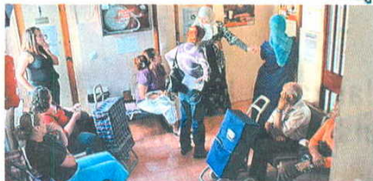
Treinta familias fueron las primeras citadas ayer para recibir la ayuda.