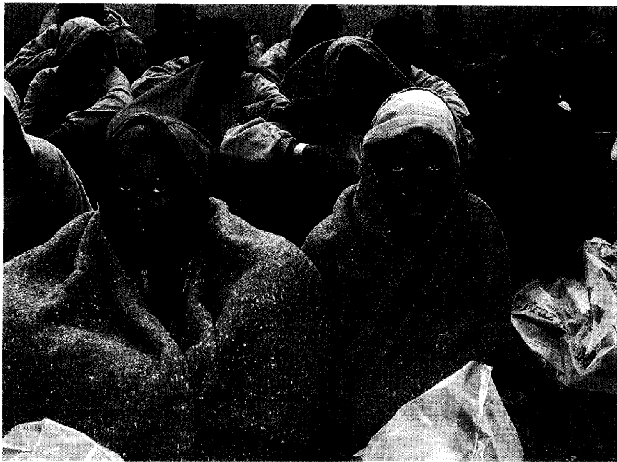
EL ÚLTIMO CAYUCO. Sesenta y seis inmigrantes subsaharianos, once de ellos menores de edad, componían el último grupo que ha llegado a Canarias, el pasado domingo

El número más importante se refiere a las readmisiones, procedimiento que se aplica a ciudadanos