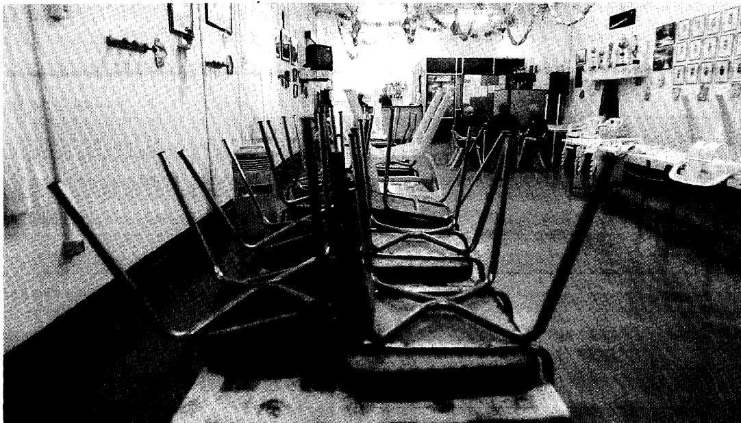
Los antiguos comedores de Construcciones Aeronáuticas, que serán sustituidos por una residencia y centro de día para mayores.