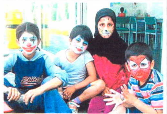
Tres de los niños que atiende la ONG Kids Company.

Y añade: "El modelo de servicios sociales está obsoleto porque los problemas de ahora son distintos. Las drogas, el acceso a las armas o las ban-