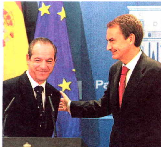
Zapatero junto al primer ministro de Malta.

Francia y Reino Unido ya han fletado aviones en común con ilegales afganos