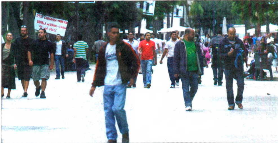
Asegura que la "saturación" a la que está sometido el municipio queda lejos del modelo catalán.

Torremadé se mostró preocupado por los efectos de la irrupción de la comunidad marroquí en la vida política al afirmar que "en las municipales se puede incidir de forma más marcada porque la fuerza es del más potente, de quien más representa", en referencia a que el 45% de la población de Salt es extranjera. Además, auguró una entrada en conflictos religiosos que pueden desencadenar graves incidentes.