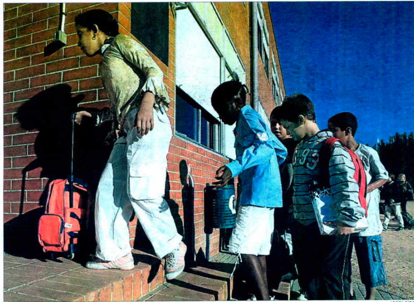
Alumnos de una escuela de Salt acceden a su escuela en este municipio

de Derecho en la Universitat de Girona. Camas es taxativo: "La población tiene derecho a instalarse donde quiera, por ley. Otra cosa es que, por ejemplo, se quiera redistribuir a los usuarios de determinados servicios como sean los educativos o los sanitarios. Pero con la ley en la mano no se me ocurre cómo se puede impedir a la gente el asentamiento. Si se prueba la identidad y se prueba la residencia, el empadronamiento es un derecho".