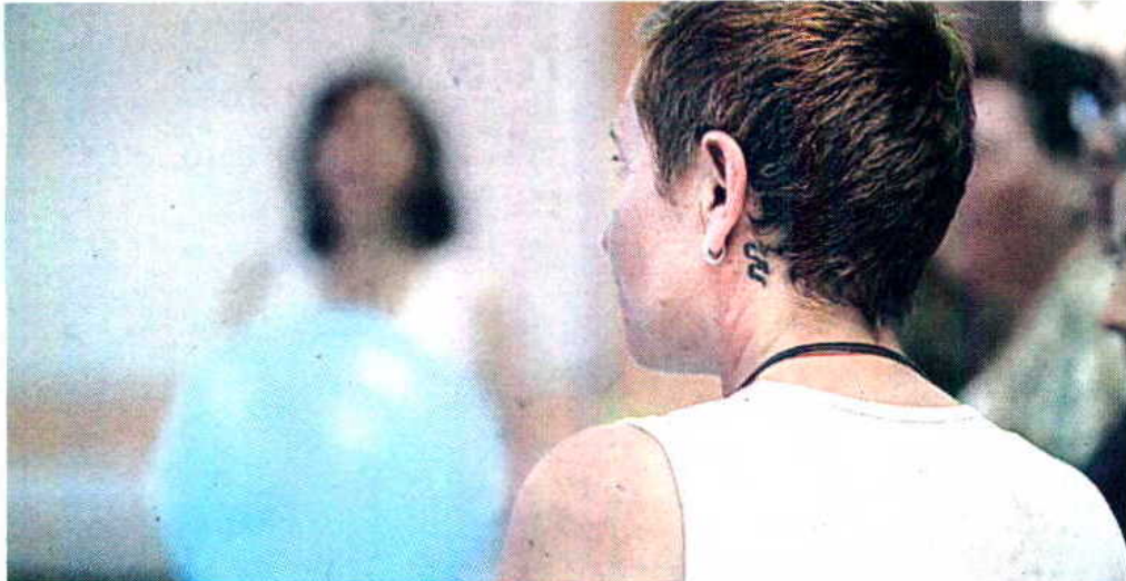
Una de las mujeres que reciben atención en el centro Ayaan Hrsi Ali, ayer.