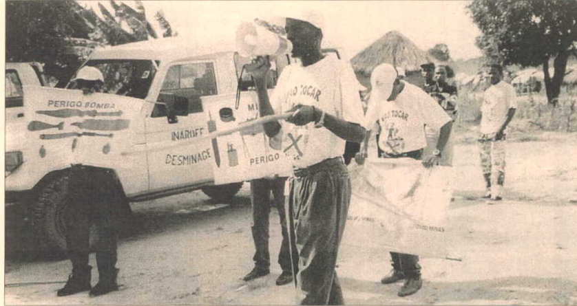
Un equipo de ingenieros desarrolla una estrategia de formación para el desminado en Angola.