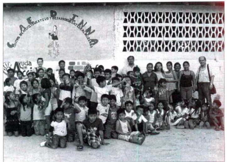
■ Pequeños de un centro de apoyo escolar, junto a los dos profesores.