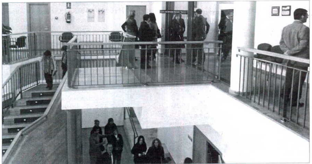
■ El municipio cuenta con un Centro de Servicios Sociales totalmente nuevo.

De las más de mil solicitudes que están recibiendo una prestación, 144 son de ayudas a domi-