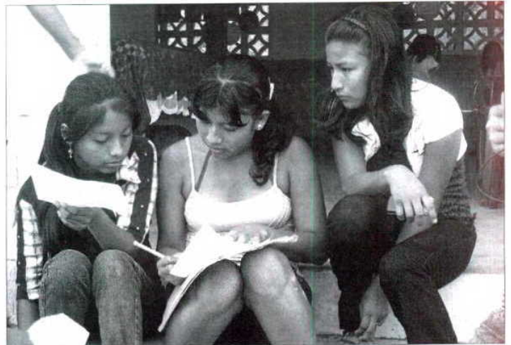
■ Un grupo de alumnas de Manantial de Colonche.

La raíz de la unión entre Ecuador y Dalías hay que buscarla también en la carrera solidaria que desde el inicio de su vínculo realizan cada año para recaudar fondos que enviar a los centros educativos de este país a través de la ONG Ayuda en Acción. Una ayuda que ha servido entre otras cosas, para rehabilitar un techo de uralita en uno de los centros vinculados, así como para la compra de nuevo material para el desarrollo de las clases.