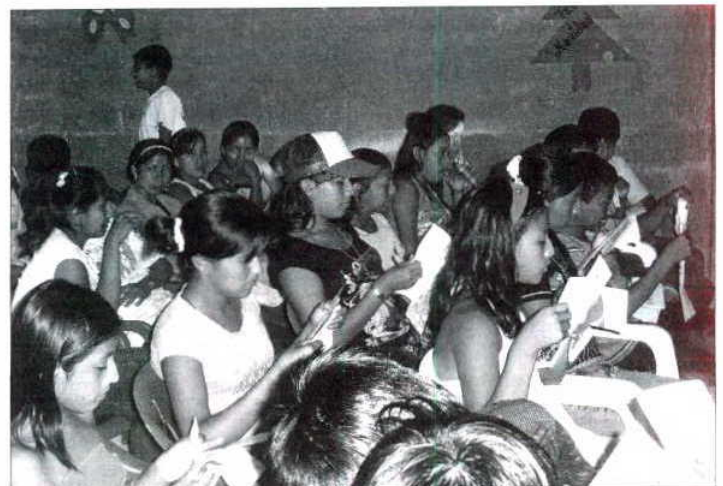
■ Un encuentro con los adolescentes en Río Seco.