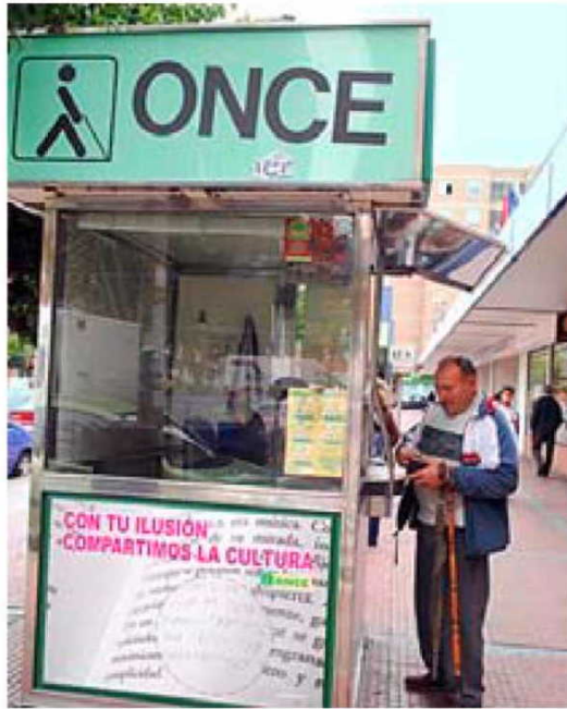
Un quiosco de la Once.

La posibilidad de vender también el cupón mediante otros medios se había convertido así en una reclamación permanente en los últimos meses -la organización de ciegos