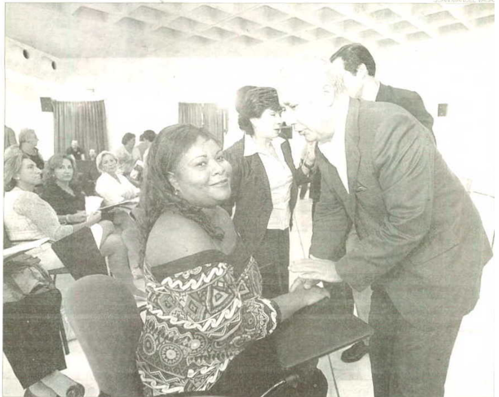
► Arenas saluda a la representante de un colectivo social de Andalucía.

Durante la reunión, Arenas aseguró que no llegará a ningún acuerdo con el presidente de la Junta, Manuel Chaves, sobre financiación autonómica sin que se haya garantizado antes la financiación para desarrollar la