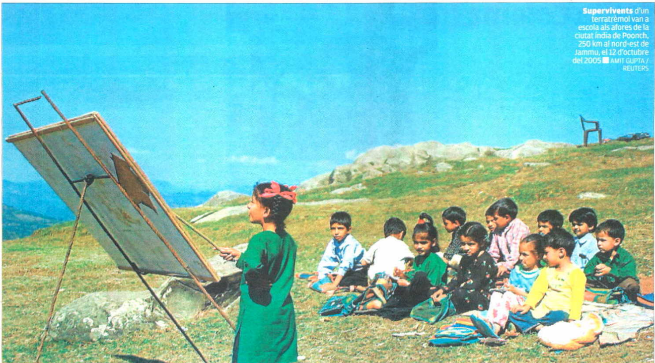
Supervivents d'un terratrèmol van a escola als afores de la ciutat índia de Poonch, 250 km al nord-est de Jammu, el 12 d'octubre del 2005