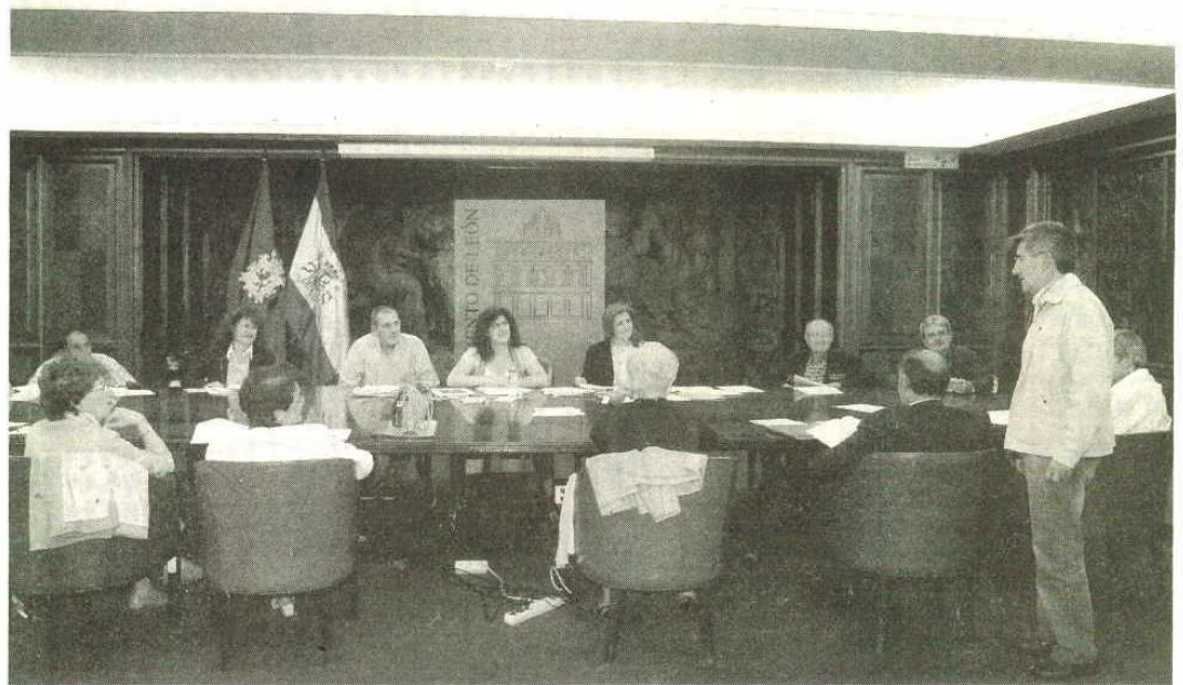
Un momento de la reunión del Consejo de Mayores en el Ayuntamiento de León

Según la nota de prensa hecha pública por la Junta, más de 26.800