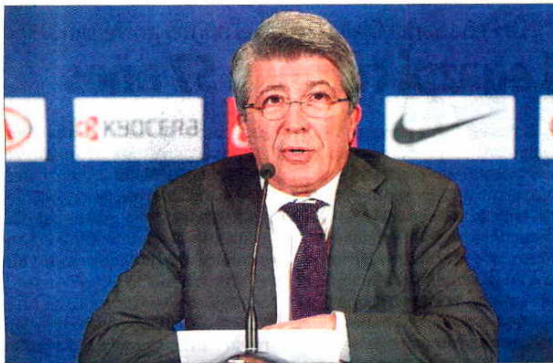
Enrique Cerezo acudirá hoy a apadrinar una nueva iniciativa de la Fundación