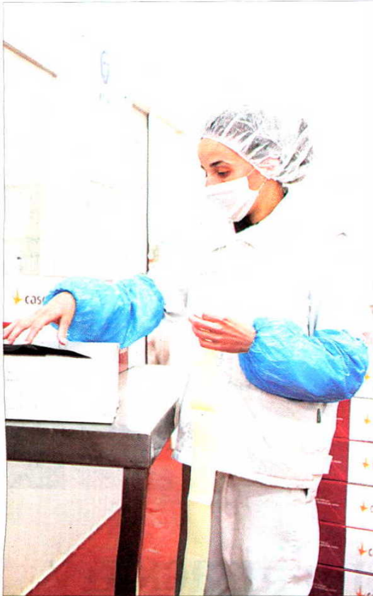
Una empleada empaqueta productos en la fábrica de Dueñas