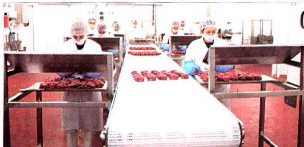
Varias mujeres preparan unos solomillos con foie en la factoría palentina, en la que tienen cabida casi un centenar de productos gourmet que se elaboran para la venta en mercados de todo el mundo