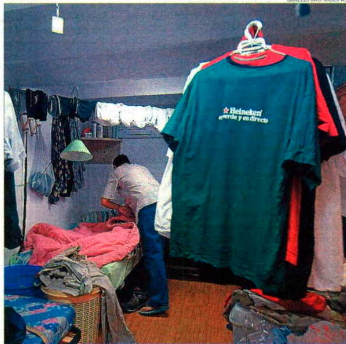
► Interior de un 'piso patera' en el barrio de Gràcia de Barcelona.

Pese a que, tras la controversia de Vic, el Ejecutivo dio un portazo a debatir sobre inmigración y empadronamiento, como le reclamaron partidos como el PP y CiU, el presiden-