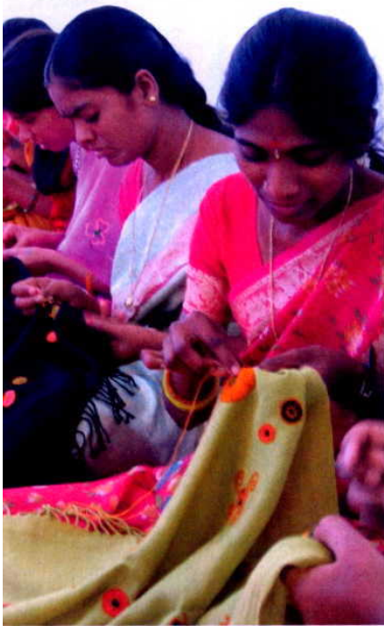
EN EL DISTRITO de Anantapur hay 958 mujeres por cada 1.000 hombres.

e higiene; apenas tienen dos habitaciones y no tienen baño por cuestiones culturales. Uno de los cuartos hace las veces de cocina y cuenta con espacio para guardar los viveres y los utensilios necesarios para preparar la comida y manipular los alimentos. El segundo se utiliza como salón y dormitorio. Las casas se levantan con materiales que se encuentran fácilmente en la zona y atienden al clima y a las costumbres del lugar, de manera que tanto en su tamaño como en su forma están en completa armonía con el entorno. Por ejemplo, su porche elevado y protegido por una cubierta responde a las condiciones medioambientales que sufren en esta zona del sur de la India: lluvias torrenciales de junio a octubre e intenso calor en las épocas premonzónicas (que en algunos momentos puede alcanzar hasta 45 °C). Además, las viviendas se construyen a 40 cm del suelo para evitar las inundaciones aunque también son un frente contra animales peligrosos como serpientes y escorpiones. Construir cada una de ellas tiene un coste de casi 1.500 euros, de los cuales la comunidad local aporta una parte en concepto de terrenos.