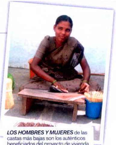
LOS HOMBRES Y MUJERES de las castas más bajas son los auténticos beneficiados del proyecto de vivienda de la Fundación Vicente Ferrer.

El Premio Cuida de Ti ha unido, por primera vez, a la popular presentadora vasca y a la Fundación Vicente Ferrer. Juntas defienden el proyecto 'Un hogar digno para las familias de Anantapur', (India), que la ONG presenta a nuestro galardón.