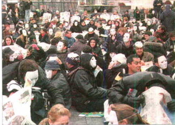
'Flashmob' contra el 'sinhogarismo'.