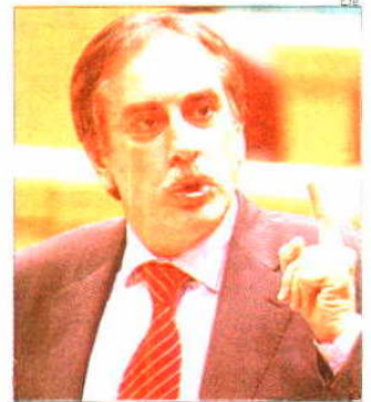
El ministro de Trabajo, Valeriano Gómez, ayer en el Congreso

tratación de las empleadas del hogar. El objetivo: que una parte de este tipo de trabajo «emerja» y se incluya dentro del régimen de la Seguridad Social. Trabajo ultima ya la reforma del régimen especial de las empleadas del hogar. Gómez no quiso entrar a valorar los efectos que está teniendo la reforma laboral por el «escaso» tiempo transcurrido desde su aprobación, pero sí dijo que se apreciaba un impulso al contrato «estrella» del Gobierno, el indefinido de fomento, cuya indemnización por despido es de 33 días frente a los 45 del contrato ordi-