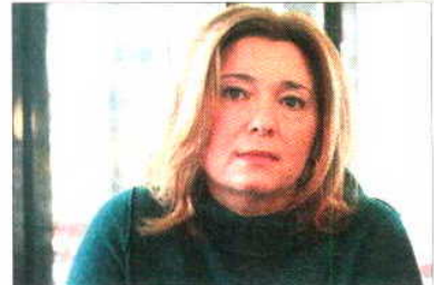
Roja en los Incorpora. / J. M.