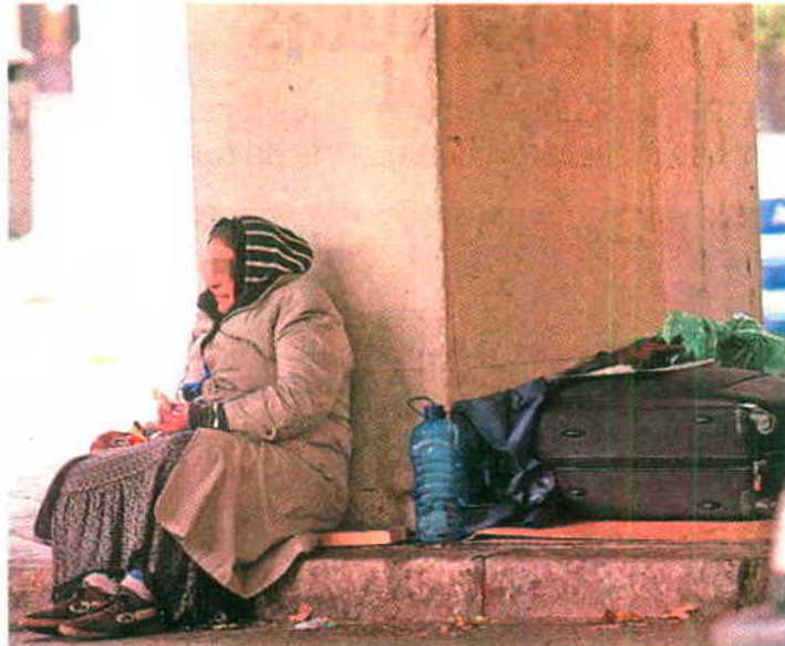
Una mujer junto a sus enseres ayer en el barrio del Salamanca.

Sin Hogar. Reconocen que hay múltiples fórmulas para ayudarles pero matizan que “hay que seguir trabajando”. Según cifras de Cáritas España hay 30.000 personas en esta situación en todo el país. Todas las asociaciones participantes hicieron hincapié en la idea de que “llegar a la calle es fácil, salir muy difícil”.