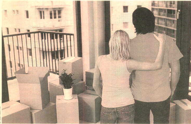
La tasa de emancipación de los jóvenes ha aumentado, pese a las dificultades económicas.

El informe concluye que la familia no se encuentra en cri-