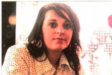
Mogán en el CaixaForum. / J. M.