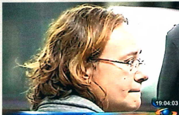
La justicia colombiana reabrió este caso, que conmocionó al país iberoamericano tras la emisión en Caracol Televisión de un video en el que la pareja maltrataba a sus hijos adoptados

ras residentes en el exterior. Adoptar, sin embargo, no es un proceso fácil. El ICBF exige, por ejemplo, que los futuros padres pasen, por lo menos, un mes en Colombia para que ellos y sus hijos se vayan adaptando. En ese tiempo el ICBF observa también el comportamiento de ambas partes y se asegura de que no habrá problemas graves de adaptación en el futuro. El proceso de adopción requiere, además, que un juez sentencie a favor de los padres.