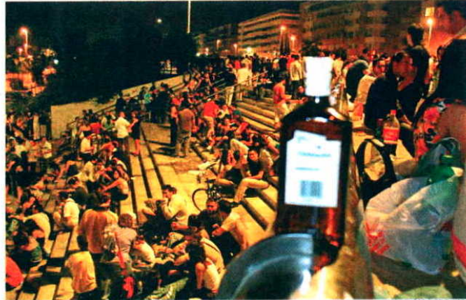
Jóvenes concentrados en un botellón en Córdoba