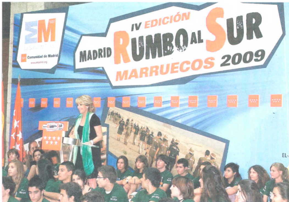
Esperanza Aguirre se reunió ayer con los cien jóvenes que participarán en «Rumbo al sur»