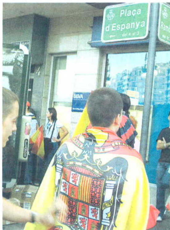
Manifestación de un grupo ultra en Valencia, en 2007. D. D.

La organización advirtió ayer de que la xenofobia y la in-