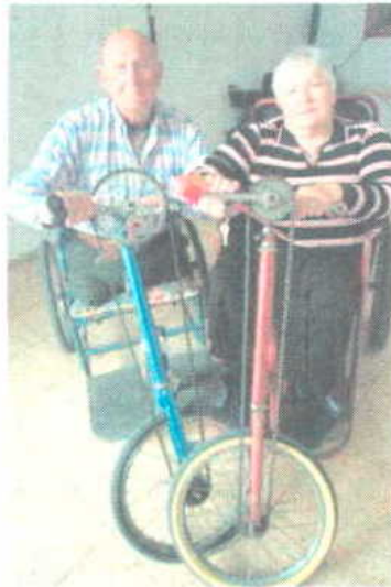
Pareja pendiente de la ayuda