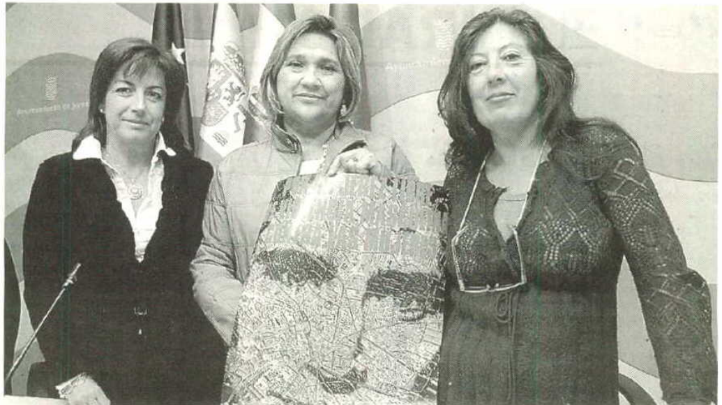
INICIATIVA. La delegada de Igualdad presentó ayer la campaña anual contra los malos tratos.

Esto impide, lógicamente, que muchas mujeres se atrevan a dar el paso, por las consecuencias que ello pueda conllevar. Por otro lado, si ya contaban anteriormente con