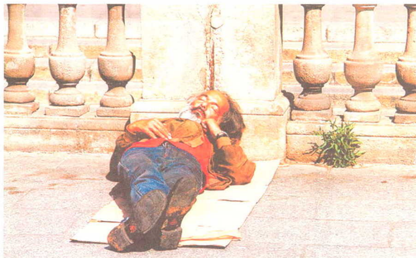
Un indigente en Barcelona. Foessa dice que 1,2 millones de españoles viven con menos de 8 euros al día.

Fijándonos sólo en el concepto de pobreza relativa , tres de cada diez personas son pobres en Andalu-