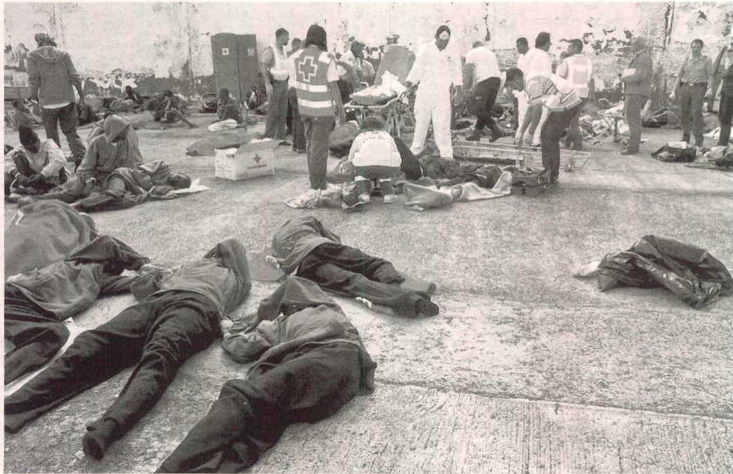
Los supervivientes de la travesía mortal, exhaustos, tras su llegada al puerto de La Restinga, en la isla de El Hierro