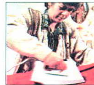
Las amas de casa podrían optar a esta pensión

–El alcance inmediato es que cualquier ama de casa, o amo de casa, que se haya dedicado íntegramente a las labores del hogar durante el matrimonio y cuyo régimen económico sea el de separación de bienes podría optar a la citada indemnización, siempre y cuando, claro está, no tenga un trabajo fuera de casa que le reporte beneficios y no se hubiera realizado gasto alguno durante el matrimonio en empleadas del hogar, puesto que precisamente el derecho nace