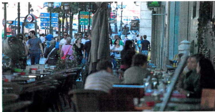
España se sitúa por debajo de la media de la OCDE. R. SEDANO