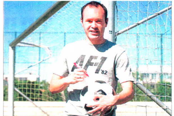
Iniesta y un balón El manchego contribuye a repartir felicidad entre los niños

Iniesta demuestra con esta campaña sus ganas de ayudar a los desfavorecidos en una campaña que desde el año 2000 ha enviado cerca de 5 millones de juguetes a niños de 40 países ●