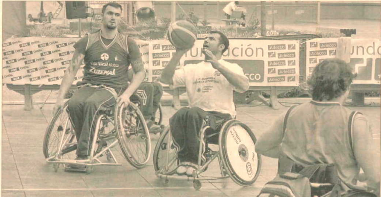
Encuentro de baloncesto social celebrado en el País Vasco y que cuenta con la Fundación Adecco entre sus patrocinadores.

La fundación promovió 1.669 contratos el año pasado