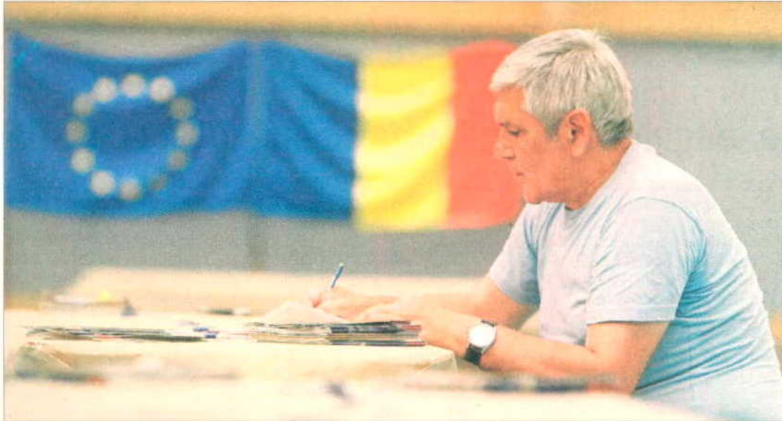
Un rumano rellena una solicitud para trabajar en su país, ayer, en la 'caravana laboral' de Alcalá de Henares.