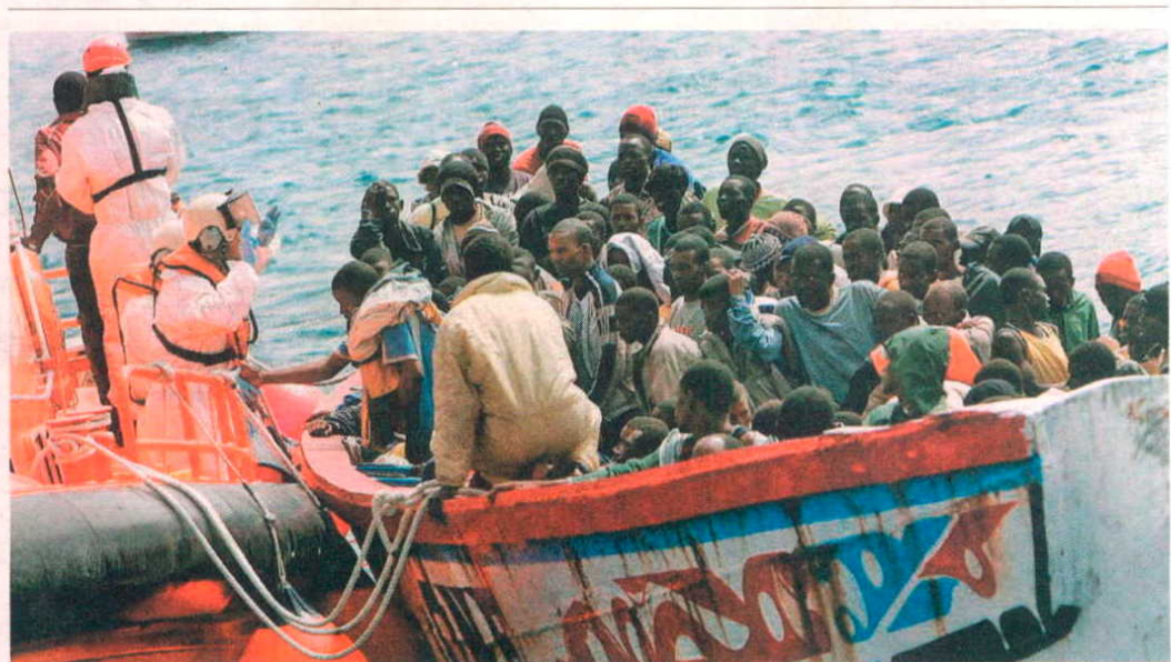
Los inmigrantes se encontraban en buen estado de salud pese a la peligrosidad de su travesía

Representantes de la tribu Ibo de Nigeria se han hecho fuertes entre los grupos de emigrantes que están entre Argelia y Marruecos. Su principal jefe opera desde Maghnia (Argelia). Estos nigerianos forman mafias que imponen su autoridad a veces de manera muy violenta, como ha podido comprobar ABC. En el campus de la Universidad Mohamed V de Uxda (noreste de Marruecos), han organizado ataques contra otras comunidades de subsaharianos que ni siquiera se han atrevido a responder las Fuerzas de Seguridad. En los jardines universitarios conviven más de 500 emigrantes. Los Ibo deciden quién entra y quién no.