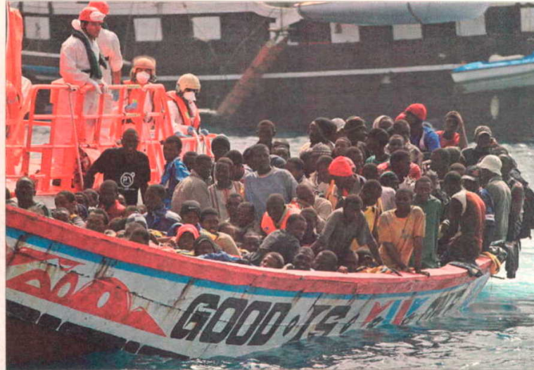
El cayuco con 179 'sin papeles' llega ayer al puerto de Los Cristianos, en Tenerife.