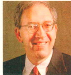
George J. Borjas

A partir de aquí, Borjas intenta mostrar las complejidades y contradicciones del fenómeno migratorio, desde una visión más economicista que sociológica. En un país receptor de inmigrantes, la solución pasa por seleccio-