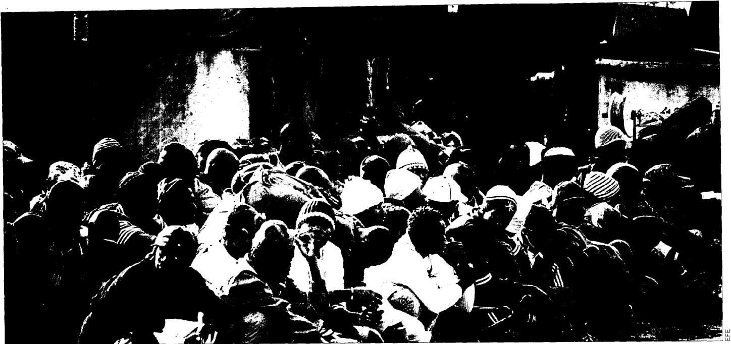
Polémica. Imagen del grupo de inmigrantes que llegaron ayer en cayuco a Canarias.

Denuncias sobre menores. La acusación pública cree que son «vagos e imprecisos» los hechos que expone la ONG Human Rights Watch reconoce que no comprobó la veracidad de lo que denunciaban los menores