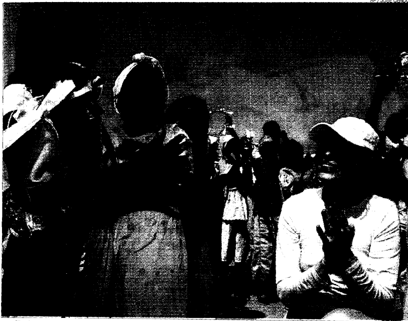
► Embajadora ► Mia Farrow, en el campo de refugiados de Kalma, en Darfur.

Es también el último empeño de un famoso de Hollywood, que curiosamente coincide con el fin de semana en el que Sean Penn aterrizó en Venezuela para visitar una