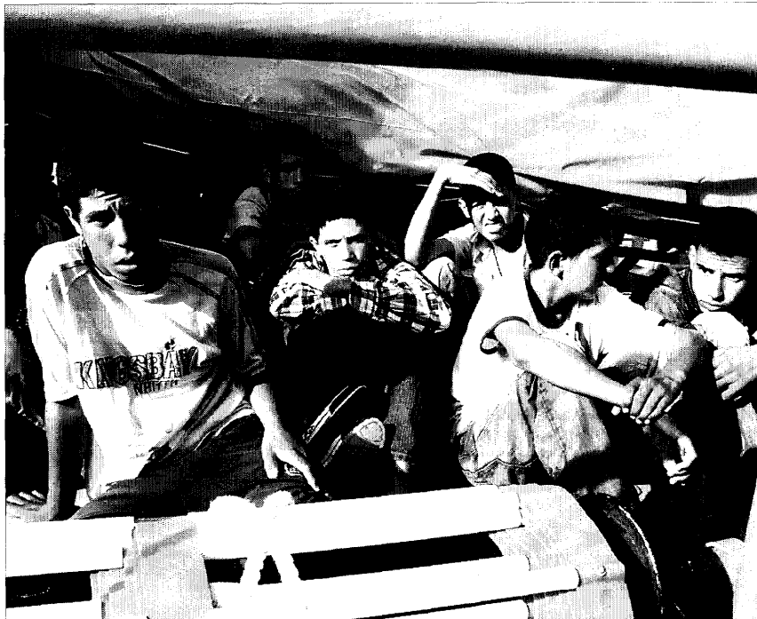
Algunos de los menores interceptados el pasado 31 de julio a bordo de una patera frente a Almería.

Pese a la habitual postura reticente del Consulado a tramitar las repatriaciones, en los últimos días se ha celebrado una reunión con responsables de la Administración Autónoma y del Estado en Almería, en la