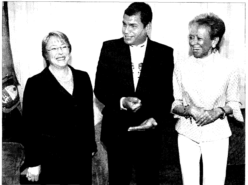
De izquierda a derecha, Michelle Bachelet, Rafael Correa y María Teresa Fernández de la Vega, ayer en Quito.

La comunidad ecuatoriana en España es la segunda más importante de extranjeros, sólo superada por la marroquí. Según los últimos datos, residen en nuestro país de forma legal cerca de 500.000 ciudadanos procedentes de Ecuador, país del que, en los últimos años, más de dos millones de personas han salido hacia el exterior en busca de un futuro mejor.