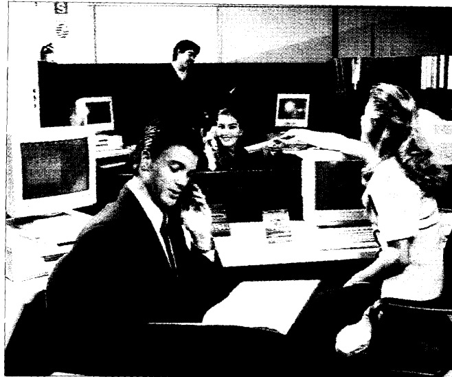
Los empresarios responsables saben que cumplen una función con la sociedad en la que viven y de la que son parte importante.

Para garantizar el éxito de la RSC es necesario que ésta se alinee con la estrategia de la empresa e identificar cuáles son sus grupos de interés,