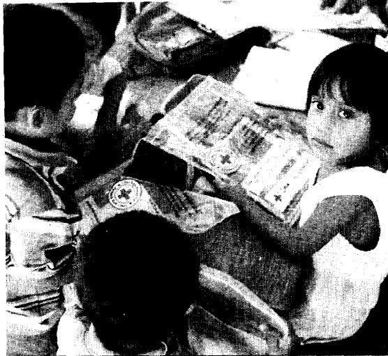
Los proyectos se desarrollan en diversos países del Tercer Mundo.