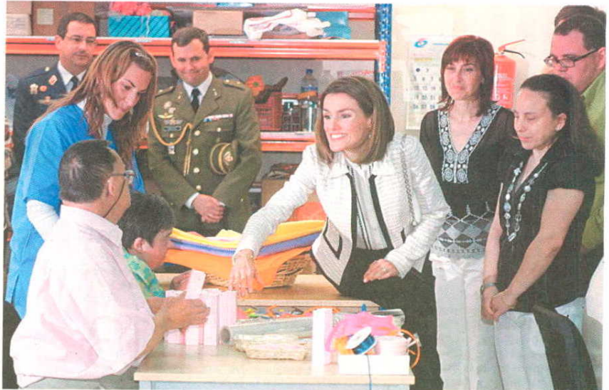
Doña Letizia se interesó por los trabajos de los usuarios, como preparar detalles de boda.

La princesa se mostró muy cercana y se interesó por los servicios que se prestan. Avelina, otra usuaria, le entregó una nota en or-