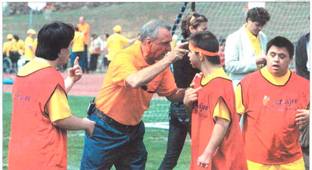
► Johan Cruyff, ayer, alecciona a uno de los chavales futbolistas en las instalaciones de la Mar Bella.

Pero aunque fútbol es fútbol, ayer se vieron otras 13 disciplinas, como básquet, atletismo, balonmano, hockey en silla electrónica o eslalom en silla de ruedas. Y Cruyff las fue visitando una a una y comprobando cómo los chavales se lo pasaban en grande. De hecho, como explicó, es