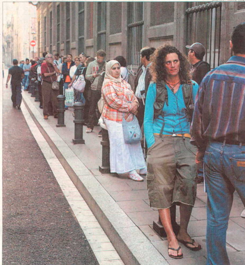
►► Un grupo de inmigrantes hacen cola ante un organismo oficial en Barcelona.

PRINCIPIO DE IGUALDAD // «Este tipo de ofertas son ilegales, pues violan el principio de no discriminación y de igualdad», señala el secretario de inmigración de Comisiones Obreras en Catalunya, Gassán Saliba, quien asegura que esas demandas de empleo incumplen la ley 62/2003. Esta establece: «Los sistemas de selección, contratación, promoción y formación para acceder a un puesto de trabajo vacante o de nueva creación han de seguir pruebas y criterios objetivos en relación a los requerimientos del puesto de trabajo, de