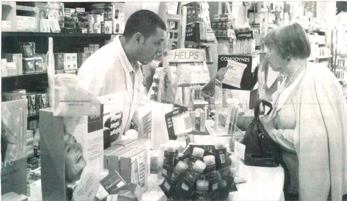
Los pacientes podrán elegir la cantidad de su aportación ya que los expositores tendrán bonos de uno, dos y tres euros.