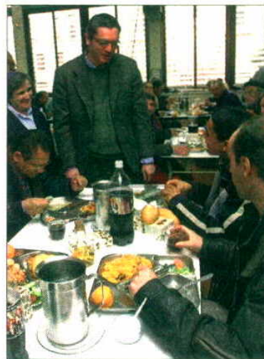
Gallardón visitando un albergue.

El día de Año Nuevo, los comedores podrán tomar cardos a la crema de almendras, secretos en salsa con cebollitas caramelizadas, tarta de chocolate y dulces navideños. Finalmente, el día de Reyes se servirán entremeses (jamón, lomo,