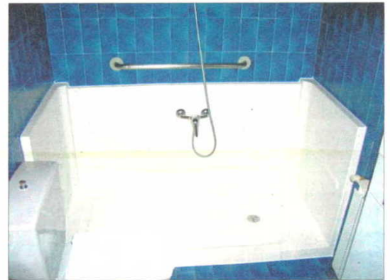
Ducha sin mamparas. / REPORTAJE GRÁFICO: FLAMA DE VIDA

Es de destacar que este tipo de aparatos está diseñado para todos los tipos de discapacidad y su activación puede hacerse mediante la voz o a través de un conmutador que pone en funcionamiento los distintos dispositivos del hogar.