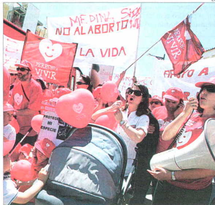
Manifestación celebrada el pasado sábado en el pueblo de Bibiana Aído