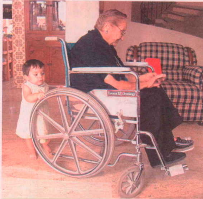
Andalucía es la que más peticiones de dependencia formuló. LGN