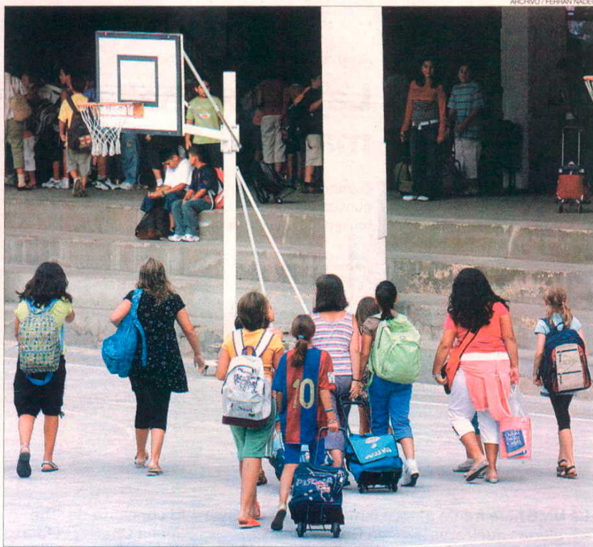
► Un grupo de alumnos del centro Jaume I de Barcelona, poco antes de comenzar la jornada de clases.

Esa batería de prescripciones no persigue que los inmigrantes se repartan entre el sector público y el concertado en justa correspondencia con sus dimensiones -60% de alumnos en la red de la Generalitat, 40% en la privada subvencionada con fondos públicos-, sino que en aquellos municipios o zonas donde residen los extranjeros la totalidad de los centros se corresponsabilice