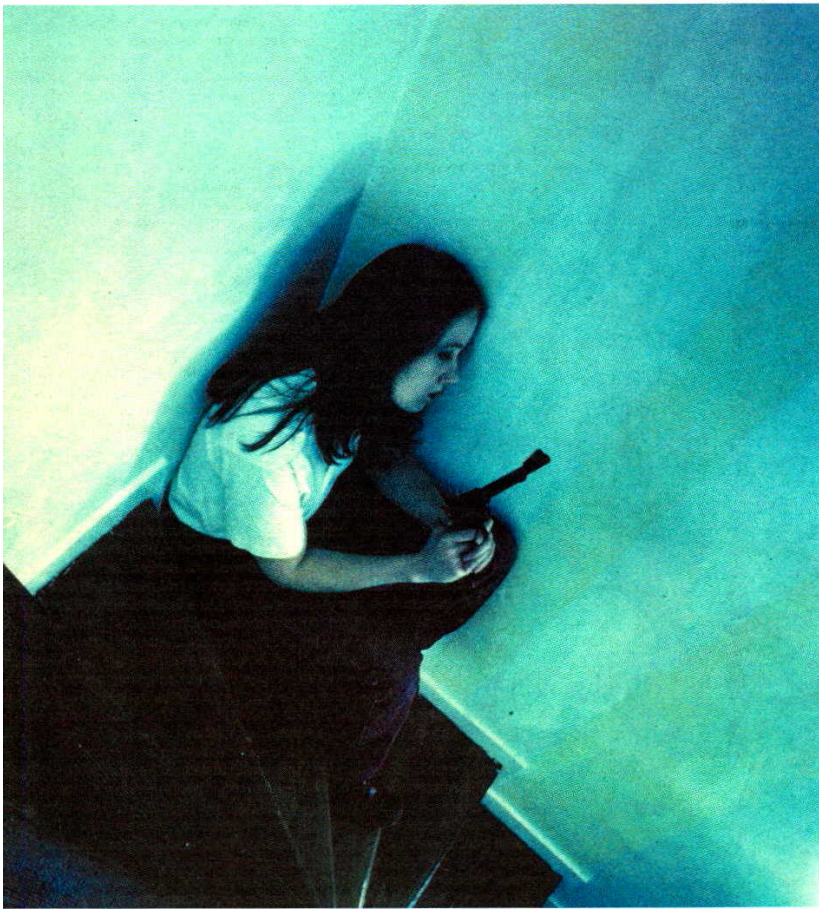
Las psicopatías no tienen un tratamiento fácil, según los expertos. Estos delincuentes son peculiares.