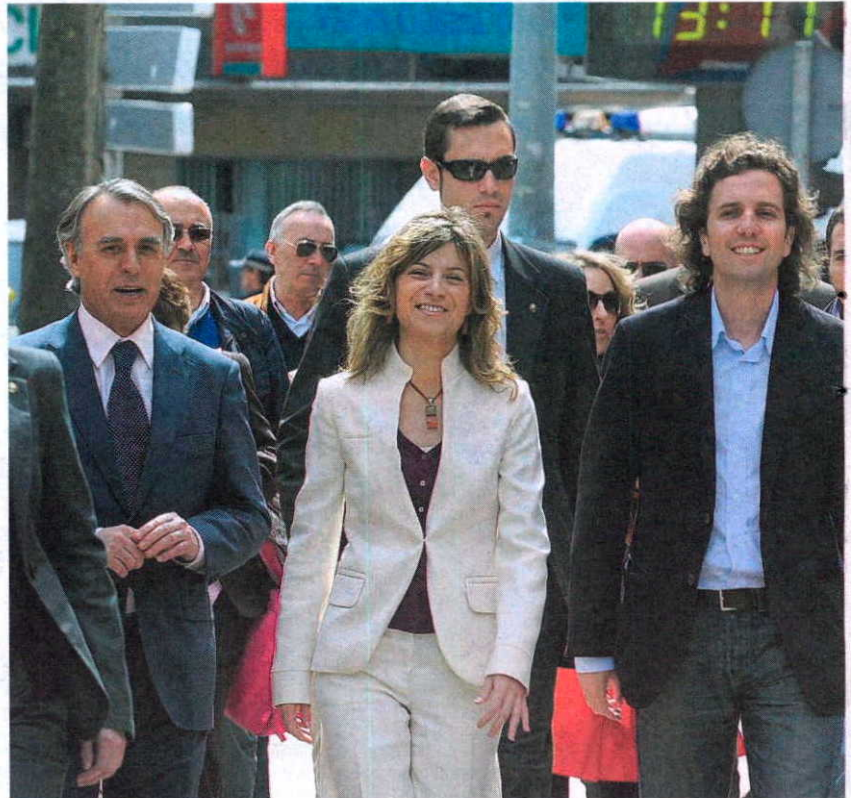
La ministra de Igualdad, Bibiana Aído, ayer durante su visita a León con otras autoridades

En su fallo, el Tribunal Superior de Justicia de Cataluña señala que el artículo 33 (el de la confidencialidad del menor) «contraviene la Ley de Autonomía del Paciente». Añade que «los padres deberán ser informados en todo caso, cuando se trate de una actuación de grave riesgo, y su opinión será tenida en cuenta para la toma de la decisión correspondiente». A juicio del alto tribunal catalán, «la norma impugnada no respeta tales prescripciones, desde el momento en que impide que los padres o tutores sean informados en todo caso, cuando el médico considere que el menor es maduro, y hace prevalecer la voluntad de éste, sin ponderar en uno y otro caso las circunstancias de edad y riesgo que establece el precepto legal».