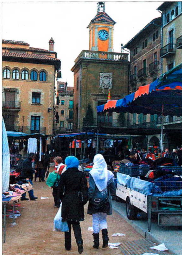
Mujeres con velo pasean por el mercado de Vic.