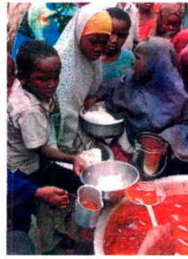
Familias en Mogadiscio.

de África. "Se ha donado un total de 351,7 millones de dólares, más otros 28,8 millones en especie", informó el presidente de la Comisión de la Unión Africana, Jean Ping, al término de la cumbre.