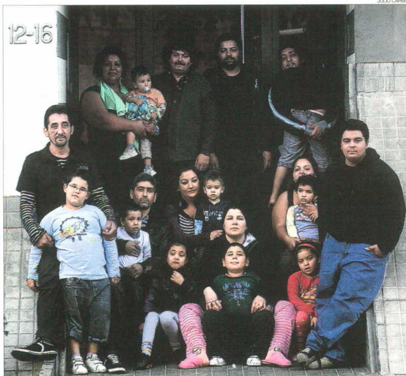
► Grupo de familias que viven de forma ilegal en los pisos de protección oficial de la calle de Tiana, 12-16.

PISOS VACÍOS / Ocupaciones aparte, en relación a la bolsa de pisos de protección oficial vacíos en la capital catalana, el delegado de Vivienda del ayuntamiento, Antoni Sorolla, explicó a este diario la semana pasada que lo normal es que siempre haya