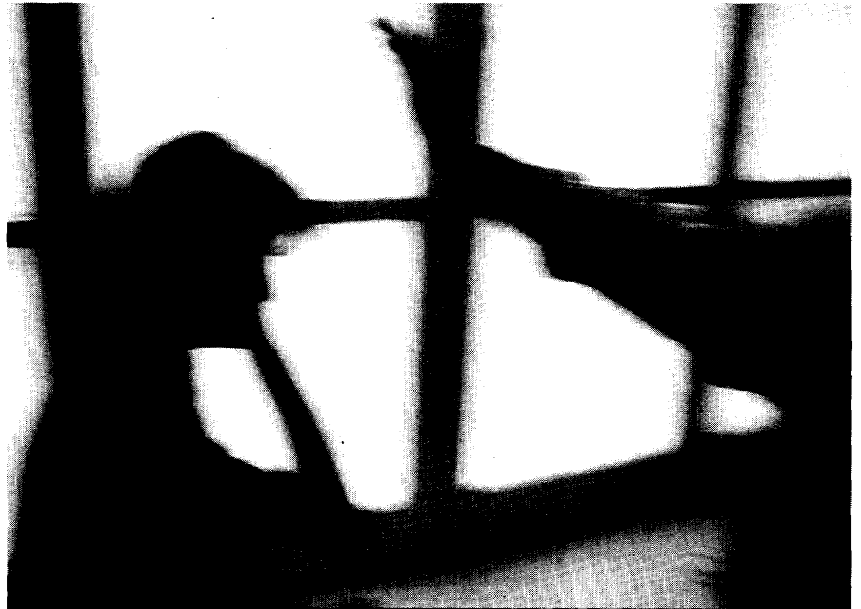
Un hombre simula un golpe a una mujer en una escena recreada.

Además de todo esto, la nueva Unidad de Violencia sobre la Mujer de Cádiz colaborará con los