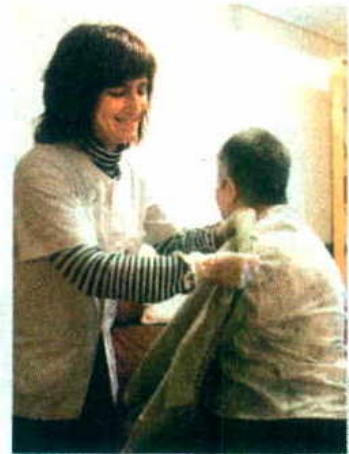
Los ancianos seguirán atendidos en casa.

penden además 7.000 puestos de trabajo. Este servicio municipal realiza desde tareas de atención personal (apoyo para higiene personal, movilización o acompañamiento para visitas médicas) hasta atención doméstica (limpieza del domicilio, planchado, compras y elaboración de comida) para personas mayores con cierto grado de dependencia y discapacitados.