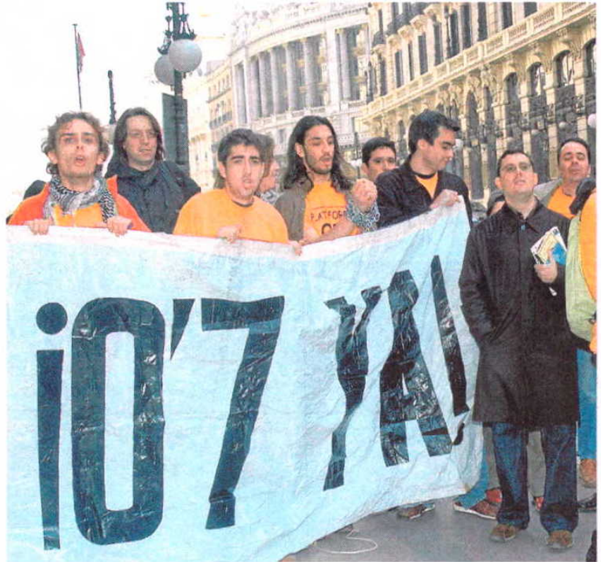
Manifestación en Madrid de la Plataforma 0,7%, en una imagen de archivo.

El Gobierno se comprometió en la Legislatura pasada a reformar los créditos FAD pa-