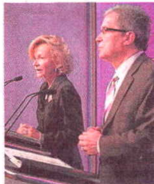
Salgado y Saura.

Una vez acordado el mecanismo de coordinación —se ha tardado más de un año— otras autonomías que contemplan en sus estatutos las mismas competencias también podrán