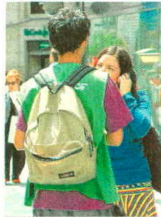
Voluntario de una ONG.

Las ONG explican que 190 millones se destinarán a financiar proyectos sociales y medioambientales en España, y el resto, a proyectos de cooperación internacional. Las ONG de Acción Social dispondrán por otro lado de unos 60 millones más para realizar programas dirigidos a las poblaciones más vulnerables y desfavorecidas. Los proyectos financiados a través de las subvenciones que convoca el