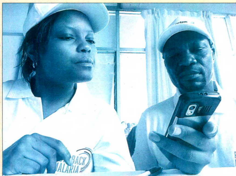
El programa de Novartis 'SMS for Life' se puso en marcha en Tanzania en 2009 para luchar contra el gran número de muertes por malaria. Los datos hablan por sí solos: se consiguió reducir el desabastecimiento de antimaláricos hasta en un 51 por ciento.

"En Novartis creemos firmemente que nadie debería morir a