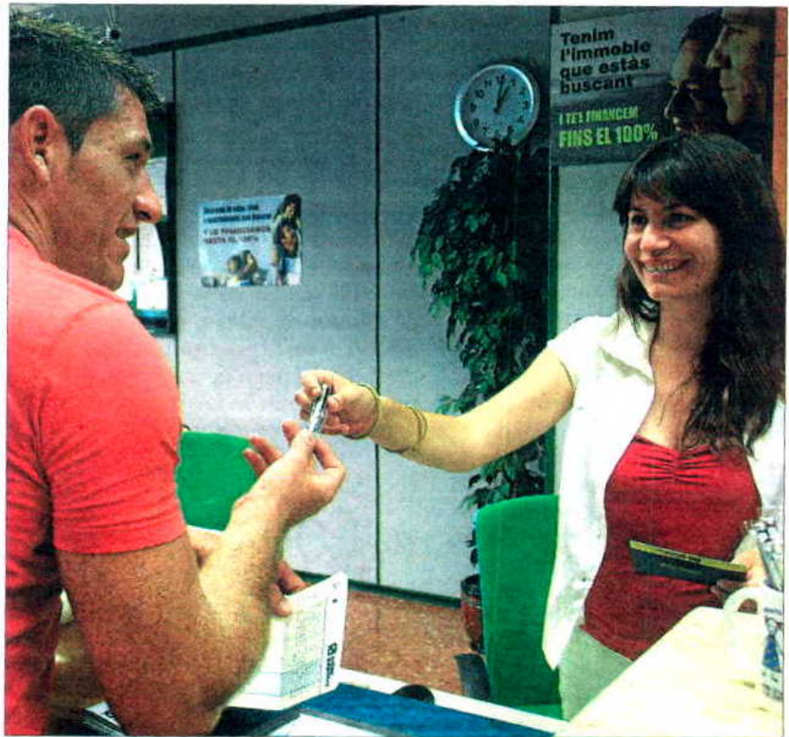
Los clientes de Caixa Popular participan en la campaña.