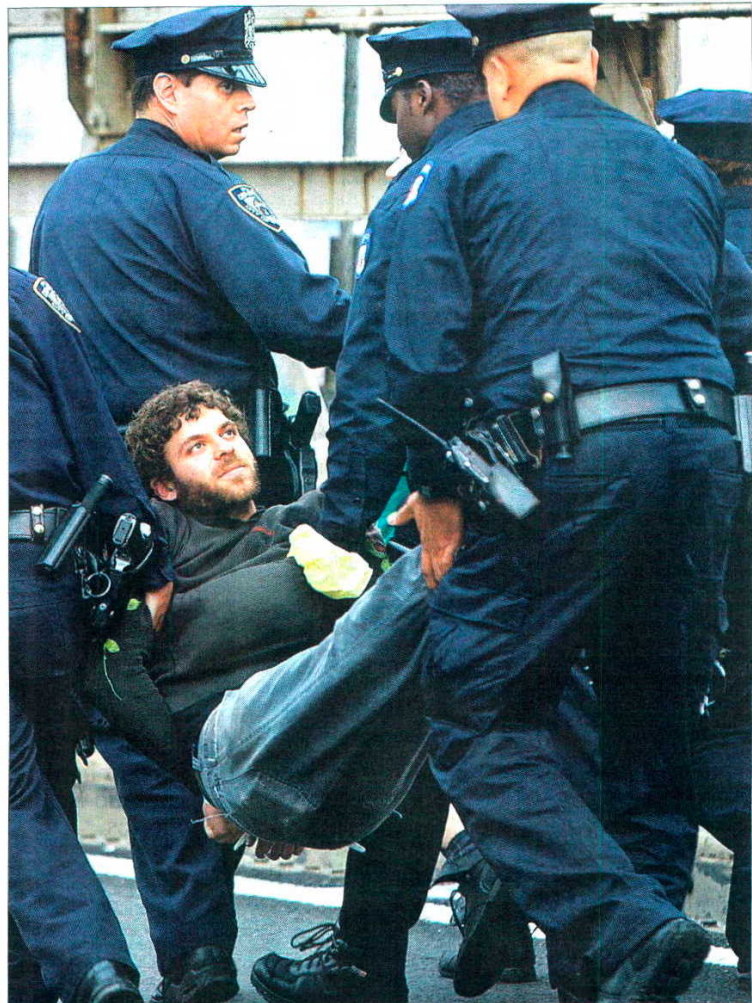
Un manifestante detenido mira a los agentes de policía en el puente de Brooklyn.

Los indignados neoyorquinos están mucho más cerca del 15-M español que de los egipcios que ocuparon la plaza de Tahrir, aunque la escasa cobertura informativa que recibió en Estados Unidos la revolución española hace que a menudo la prensa y la gente solo les asocie con la primavera árabe . El malestar ante una sociedad