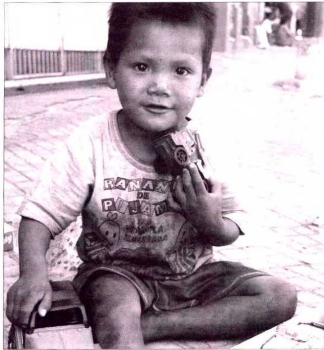
La celebración reivindicará el cumplimiento de los derechos de los niños. /DP

¿QUÉ ES LA CDN?. La Convención sobre los Derechos del Niño (CDN) es un tratado internacional de las Naciones Unidas sobre los derechos del niño reconoce que todas las personas menores de 18 años tienen derecho a ser protegidos, desarrollarse y participar activamente en la sociedad, estableciendo que los niños son sujetos de derecho, aunque el reconocimiento legal de los derechos subjetivos no implica automáticamente que éstos sean realmente efectivos.