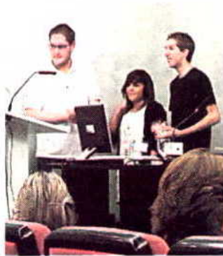
La entrega de premios.

● El Consejo de la Juventud de la Comunidad de Madrid (CJCM) reconoció por segundo año las mejores iniciativas solidarias de entidades juveniles. En esta edición el primer premio se lo llevó el proyecto Musikarte del Centro Juvenil Paseo, un taller de música creativa para aprender guitarra, batería y bajo.