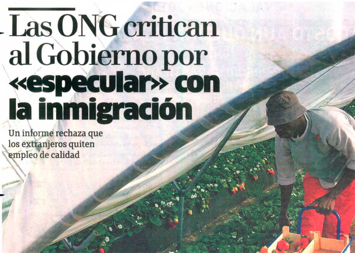
Los empresarios agrícolas tienen que recurrir a los inmigrantes para la recogida de la fruta.

Un informe rechaza que los extranjeros quiten empleo de calidad