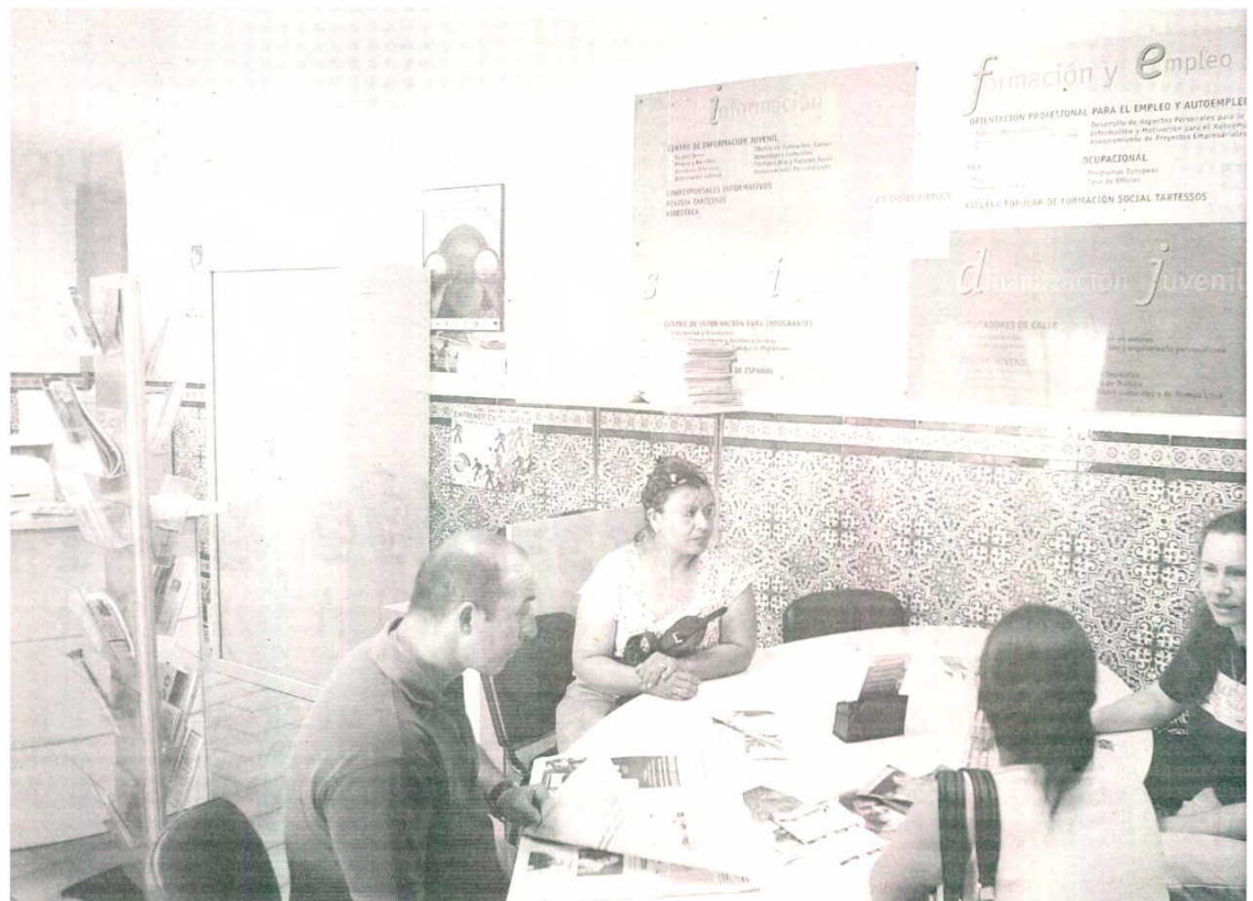
Algunos extranjeros acuden a Tartessos, en Cádiz capital, en busca de ayuda, formación y orientación laboral.

Los únicos sectores donde aún hay demanda de mano de obra son los servicios y la agricultura