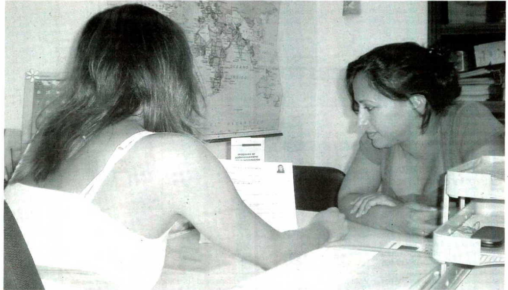
El asesoramiento personalizado es uno de los servicios que ofrecen las entidades que trabajan con personas inmigrantes. ■ A. J.

Según se concluye el Observatorio de la Inmigración de Andalucía, la denominada «estabilización del saldo migratorio» es una «reacción lógica ante el deterioro sufrido por el mercado laboral en España». Curiosamente, quienes más están sufriendo las consecuencias de la crisis son aquellos que llevaban más tiempo viviendo entre nosotros.