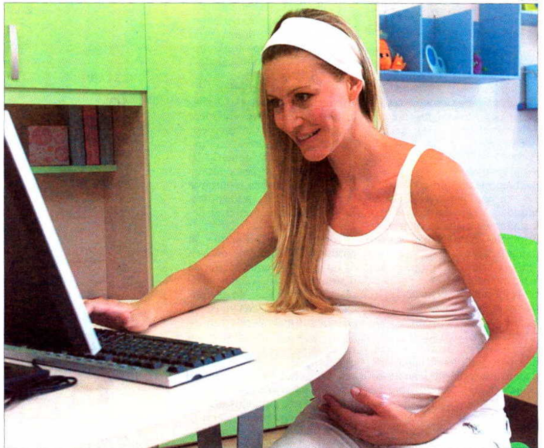
El TS ha condenado a una clínica sevillana a indemnizar a una cirujana plástica que trabajaba allí