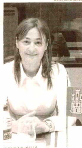
La consejera de Trabajo y Empleo asistió a la Conferencia Sectorial.

Por otro lado, la consejera puso en valor la importancia de la Conferencia Sectorial ya que en ella se ha informado a las comunidades autónomas sobre el nuevo proyecto de Ley de reforma de la