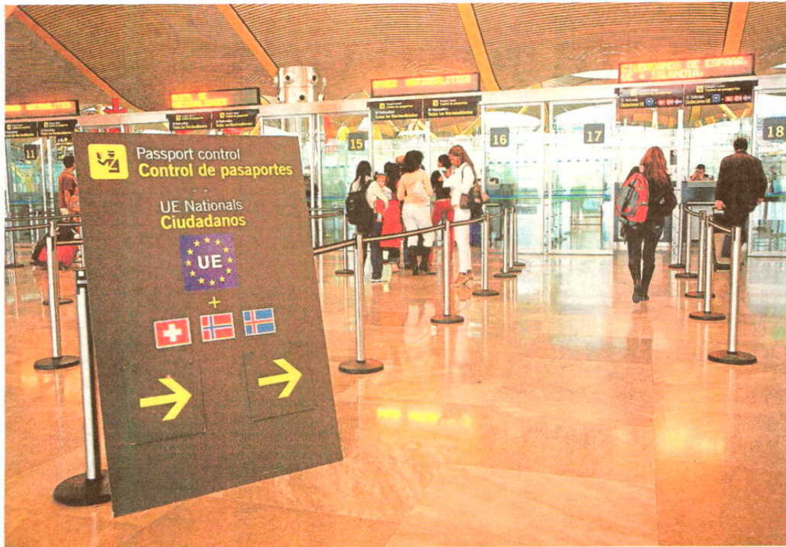
Pasajeros ante un control de pasaportes en el aeropuerto de Barajas, en Madrid.