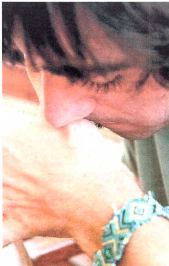
El consumo de cocaína en España empieza a los 15 años.

En el análisis "se ha expuesto a varios ratones en un ambiente determinado durante el consumo de drogas [cocaína y éxtasis], y se ha comprobado que los animales adolescentes vuelven al sitio donde estaba la droga", explica Miñarro. Así se detecta la adicción. "Lo mismo pasa con el alcohol, pero en este caso el riesgo es incluso mayor", agrega el investigador.