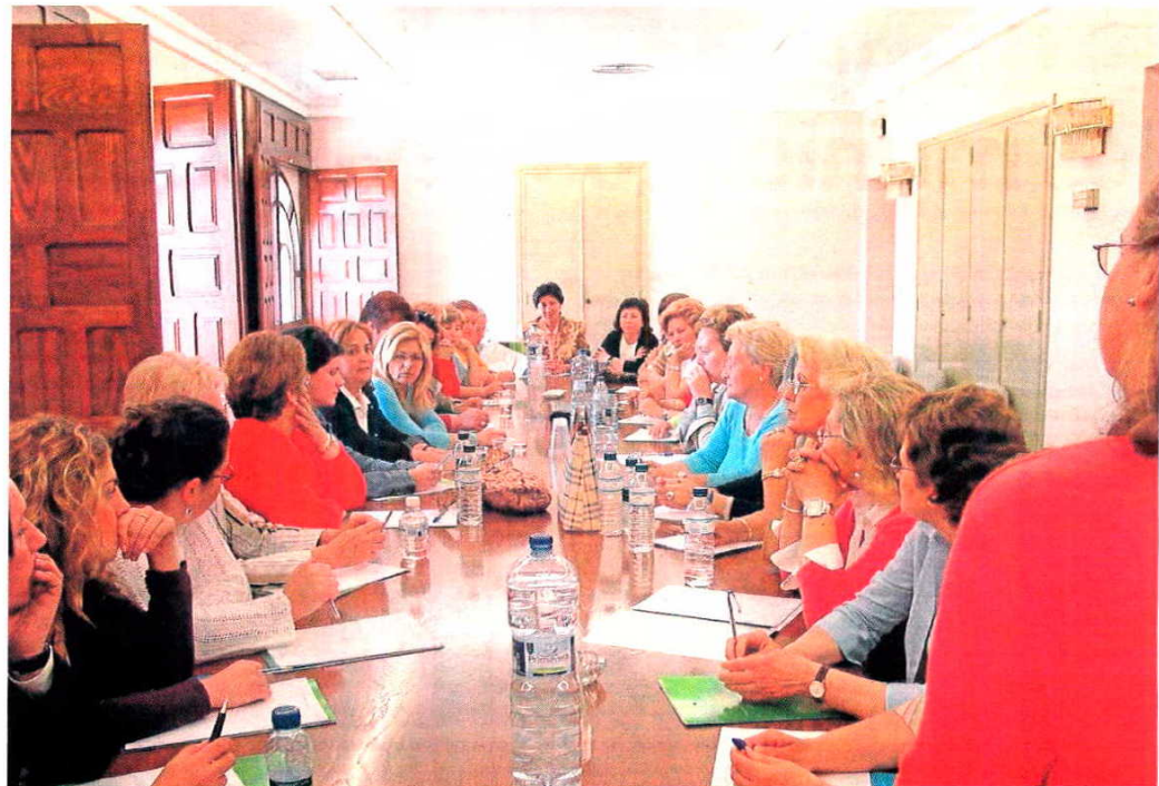
En la imagen, una de las sesiones de trabajo con mujeres empresarias organizadas en la comarca Sierra Sur de Sevilla.

"La idea gustó mucho tanto a los responsables autonómicos como en Bruselas, y permitió la realización de un estudio socioeconómico a nivel andaluz sobre esta temática (que resultó bastante completo), aunque no conseguimos profundizar en el segundo de los objetivos, que se centraba en la promoción de un trabajo en igualdad en el ámbito de las Pymes rurales, precisa-