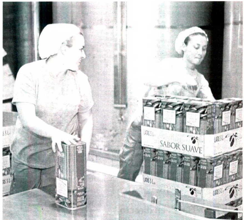
La mujer rural suele ocupar mayoritariamente en el sector industrial puestos no cualificados.

planteados intentará integrar la perspectiva de género en la gestión de los programas de desarrollo, gestionados por entidades públicas en los núcleos de población rurales.