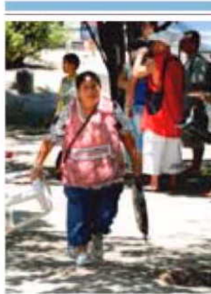
Inmigrante en Madrid. ADN