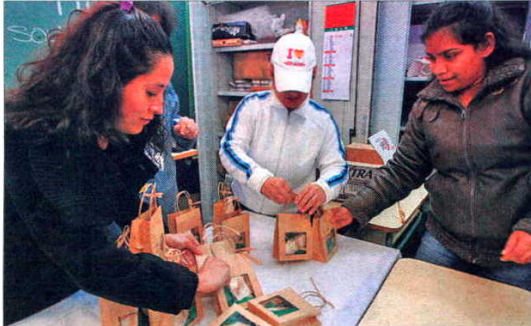
Sobre estas líneas, jabones artesanales; abajo, el aula en el que se imparten los talleres; a la derecha, una 'Menina' confeccionada en hilo.