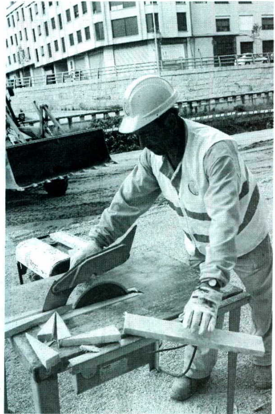
Un trabajador portugués en una obra en Ourense.

Cabe precisar, asimismo, que los retornados no están contabilizado en estos datos, ya que suelen tener doble nacionalidad (española y la del país donde han vivido), pero en los censos municipales se contabilizan como españoles. En todo caso, en el año 2007 (último año con datos disponibles) regresaron a Ourense 422 emigrantes, de un total de 1.981 que volvieron a Galicia. La mayoría de los que regresan lo hacen a sus municipios de origen o, en todo caso, a la cabecera de comarca o de provincia respectiva. De hecho, las zonas más rurales (como Viana en Ourense o A Fonsagrada en Lugo) son las que registran un menor volumen de retornados. ■