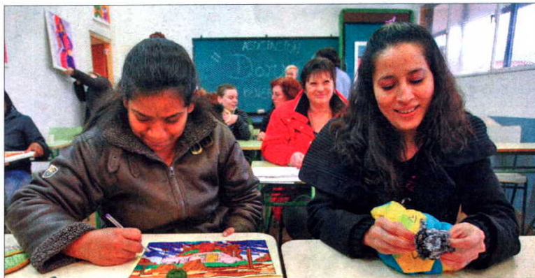
Dos de las internas que han ayudado a los damnificados del terremoto de Haití con sus trabajos.

«Tengo amistades allí que han sobrevivido, pero se han quedado sin nada. Entiendo perfectamente su sufrimiento porque yo también perdí mi casa en un ciclón y son