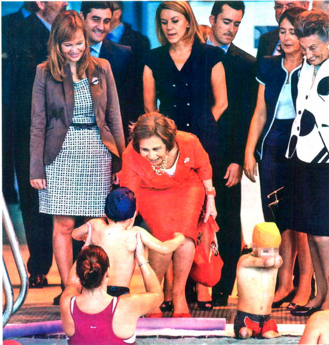
Doña Sofía saluda a algunos de los niños que se ejercitan en la piscina del polideportivo ayer inaugurado