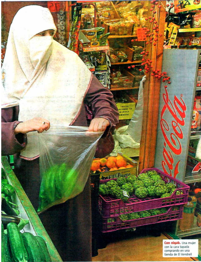
Con niqab. Una mujer con la cara tapada comprando en una tienda de El Vendrell

Se limita a decir que las mujeres se han de tapar pero no precisa más